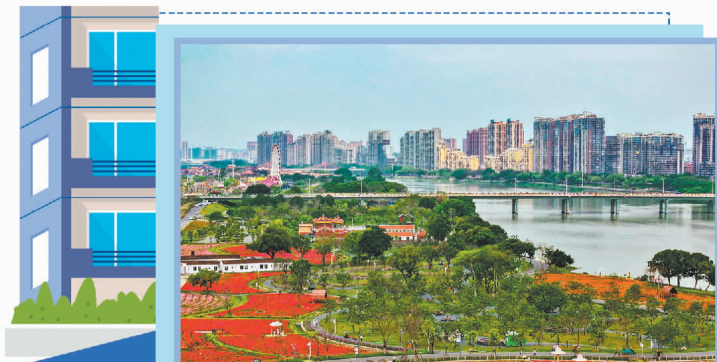
福建漳州龙江岁月景区及周边城市景观。

乌鲁木齐市天山区东门街道光华路社区光华小区改造后，受到小区居民好评。居民告诉记者，环境整洁了，生活在这里十分舒心。光华路社区党委书记贾厚文介绍，光