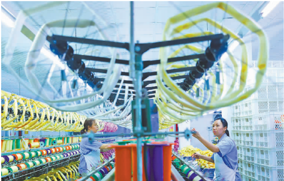
近年来，重庆市黔江区延伸蚕桑产业链，建起多家丝绸企业，加工丝绸产品，销往海内外。图为工人在黔江高新区一丝绸企业生产车间纺丝。