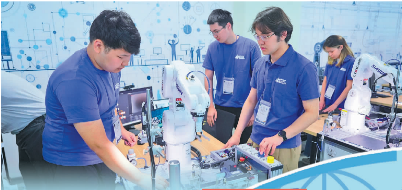
5月22日,在哈萨克斯坦首都阿斯塔纳的欧亚国立大学鲁班工坊,学生操作人工智能专业的教学器材。

今年秋季 中国将举办首届“雄安 全球治理论坛” 邀请各界共商改革完善全球 治理大计