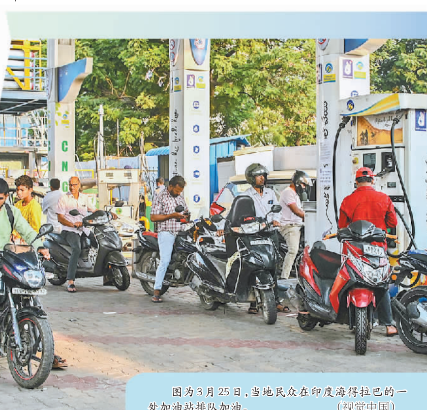
图为3月25日,当地民众在印度海得拉巴的一处加油站排队加油。