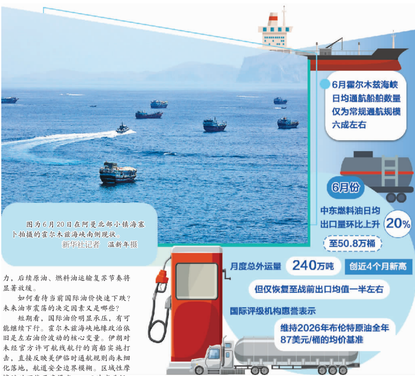
图为6月20日在阿曼北部小镇海塞卜拍摄的霍尔木兹海峡南侧现状。

荷兰国际集团(ING)在最新研报中明确提出，当前霍尔木兹海峡航运复苏仍然存在结构性缺陷：现阶段激增的通航船舶几乎全部是3月份封锁后滞留波斯湾的待外运油轮，属于积压运力一次性集中释放，空载驶入波斯湾前往各原油港口装货的油轮数量依旧处于历史偏低水平。同时，由于商船遇袭事件时有发生，国际海事组织已经暂停滞留海员与船舶的大规模疏散计划，船东、能源贸易商避险情绪再度升温，短期内不会大规模向霍尔木兹航线投放新增运