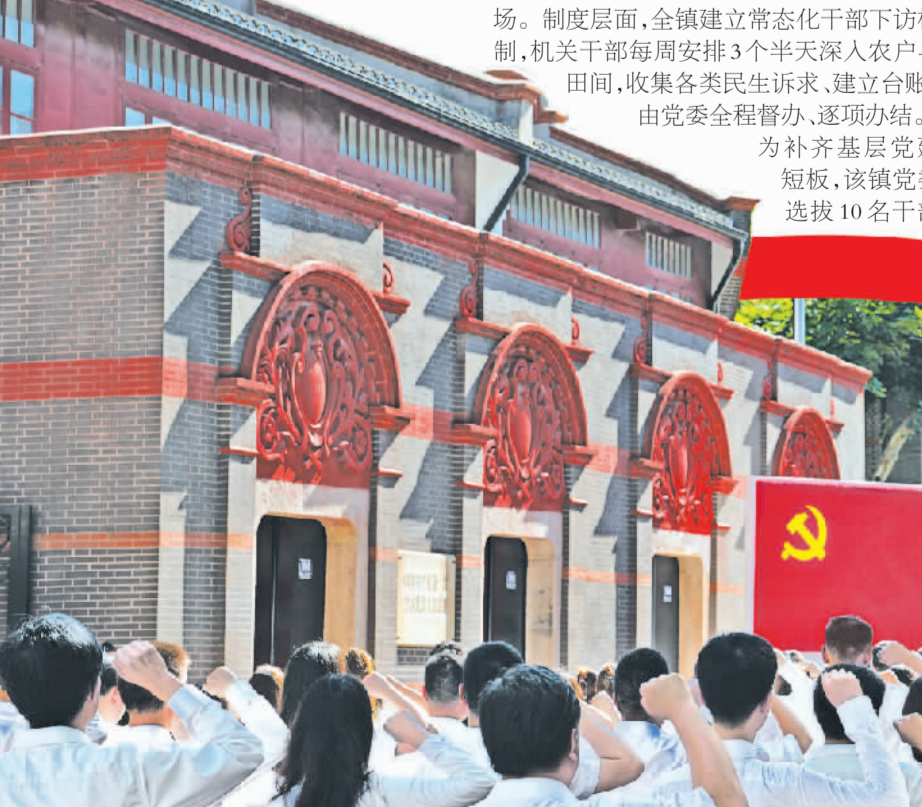
上海市新党员代表入党宣誓活动在中共一大会址前举行。