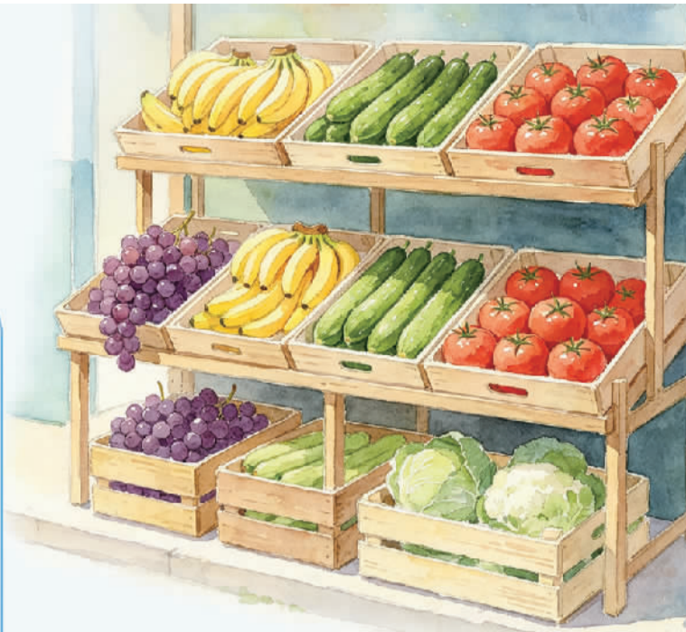
注:本版农产品数据辐射范围包括湖南全境以及周边贵州、广东、广西、江西、湖北、重庆的部分地区

对农户与产地端而言,应准确把握节气节奏,提前布局时令品类;对经销商与流通企业来说,需加强产地分级分选、冷链运输等能力,确保“从枝头到舌尖”的新鲜度;对电商平台及零售终端来说,可借助消费数据预测时令品类的需求峰值,提前制定营销与备货方案,同时通过产地直播、溯源标签等方式增强消费者对品质的信任。此外,各地可依托地域特色,培育“一县一品”公用品牌,将时令优势转化为市场竞争力。