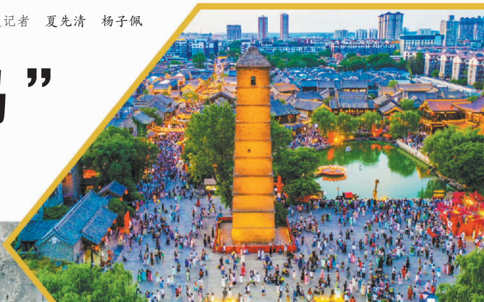
河南洛阳的洛邑古城，是集游、玩、吃、住、购于一体的综合性人文旅游观光区。

“十五五”开局，“旅游强国建设”首次被写入国家五年规划。当下，我国旅游业正处在从规模扩张迈向价值跃升的转型期，景区建设同质化、网红热度难持续、文旅融合不充分等问题亟待破解。河南省洛阳市坐拥千年文明积淀、兼具山水生态禀赋，却没有躺在资源上“啃老本”，而是以文旅融合重塑发展逻辑，以“顶流”之势脱颖而出。