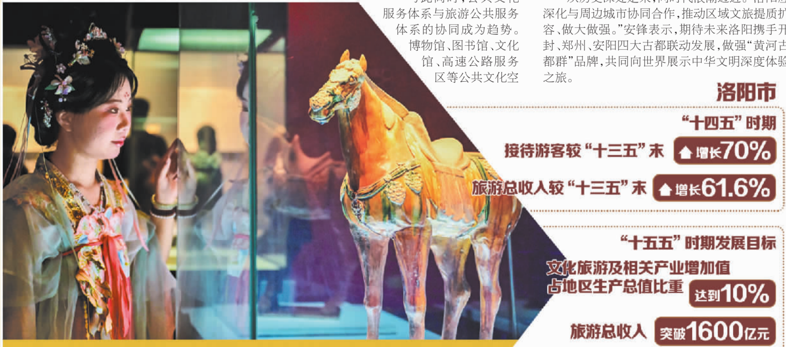
洛阳博物馆内，游客驻足欣赏展品。

精细服务是承接流量的关键。“泼天流量”随时可能降临，但能否接得住，考验的是精细治理能力。一些地方花重金打造网红标签，游客来了却遭遇吃饭贵、停车难、如厕远，再好的创意也留不住人。反观洛阳，一系列细微举措折