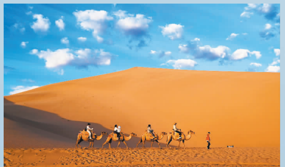
▼6月20日,游客在甘肃省敦煌市鸣沙山月牙泉景区游玩,感受自然之美。

本版编辑 李秋昶 高妍 投稿邮箱 jrbdz@jrb.com.cn 投稿网站 https://v.jingjiribao.cn/