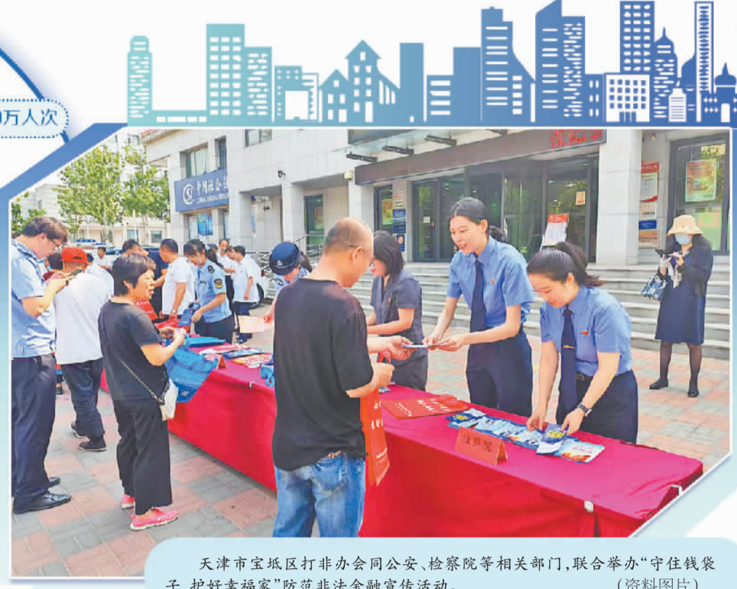
天津市宝坻区打非办会同公安、检察院等相关部门,联合举办“守住钱袋子 护好幸福家”防范非法集资宣传活动。(资料图片)

形式开展。“目前累计发放宣传资料5万余份,覆盖人群1.2万余人次,辖区居民防非知识知晓率超95%。”