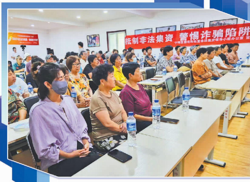
宁河区打非办联合大北镇政府,面向辖区中老年群体开展防范非法集资精准宣讲。(资料图片)

天津的数据同样印证了这一趋势。2024年至2025年,天津市共核查举报投诉线索306条,列入风险线索排查台账85条,截至2025年底处置完毕79条,风险化解率93%。非法集资案件发案数量、集资金额、参与人数3项指标