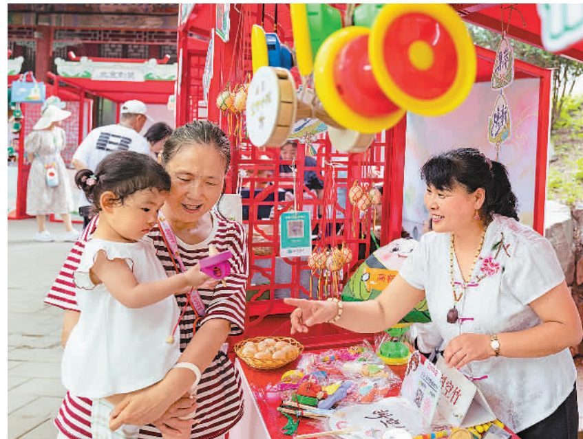
右图 6月19日，北京北海公园非遗文创市集，工作人员向游客介绍非遗产品。