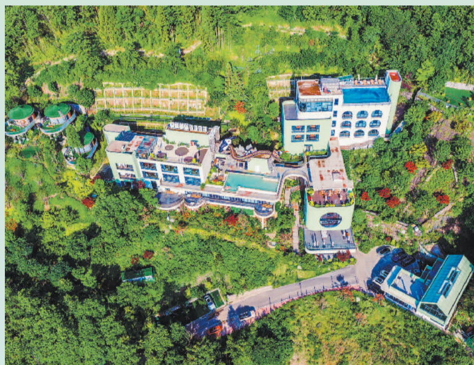
▼6月14日,四川省华蓥市红岩乡高顶村,由废弃煤矿改建而成的主题山居民宿吸引市民前来休闲度假。