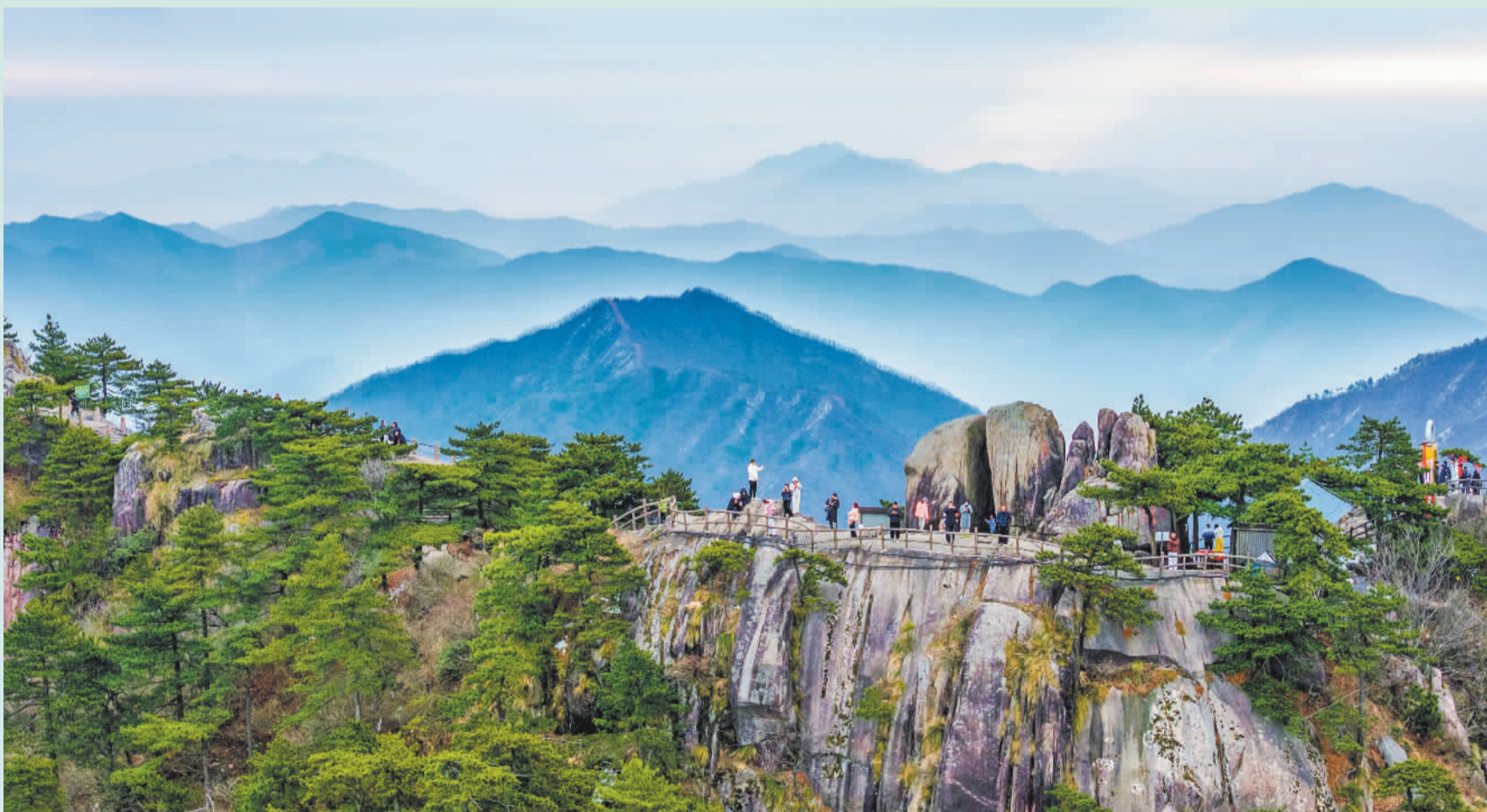
▲2月19日,安徽省池州市九华山风景区,层峦叠嶂,游客纷至沓来。