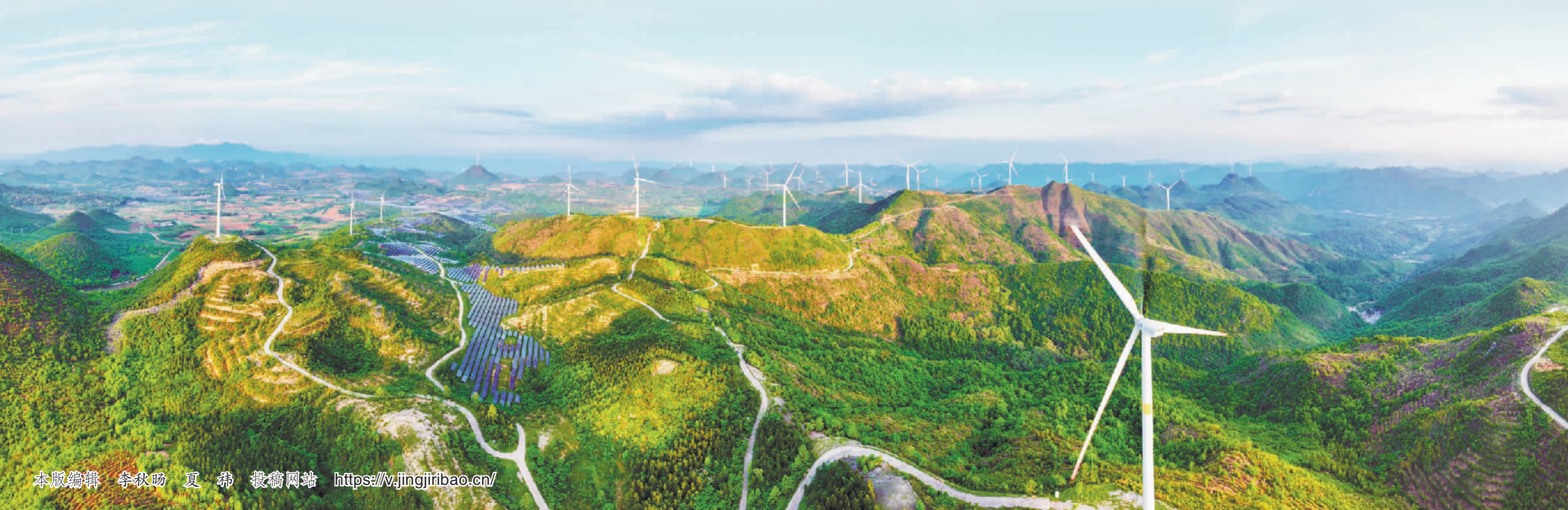
▼4月19日,广东省清远市阳山县小江镇八界山大型风光互补新能源基地,风力发电机组与山峦相映成景。