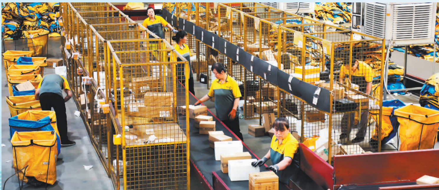
▲6月9日，位于河北廊坊固安县的中通快递华北转运中心一派忙碌景象。