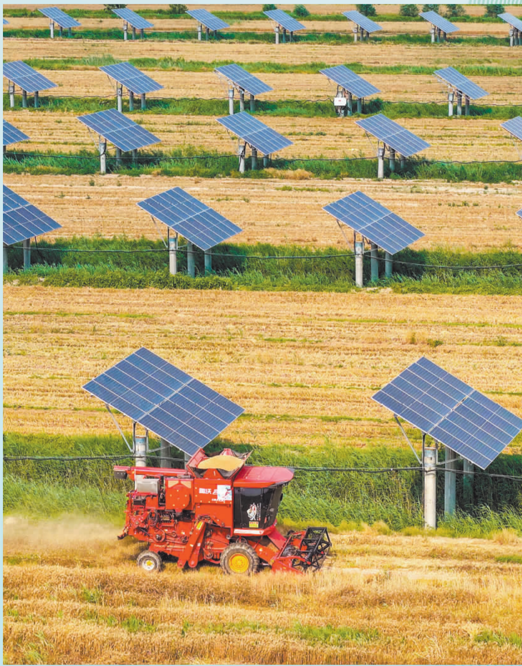
▲6月12日,山东省乐陵市铁营镇张王官村“农光互补”光伏发电项目基地,农民驾驶联合收割机在光伏板间作业。