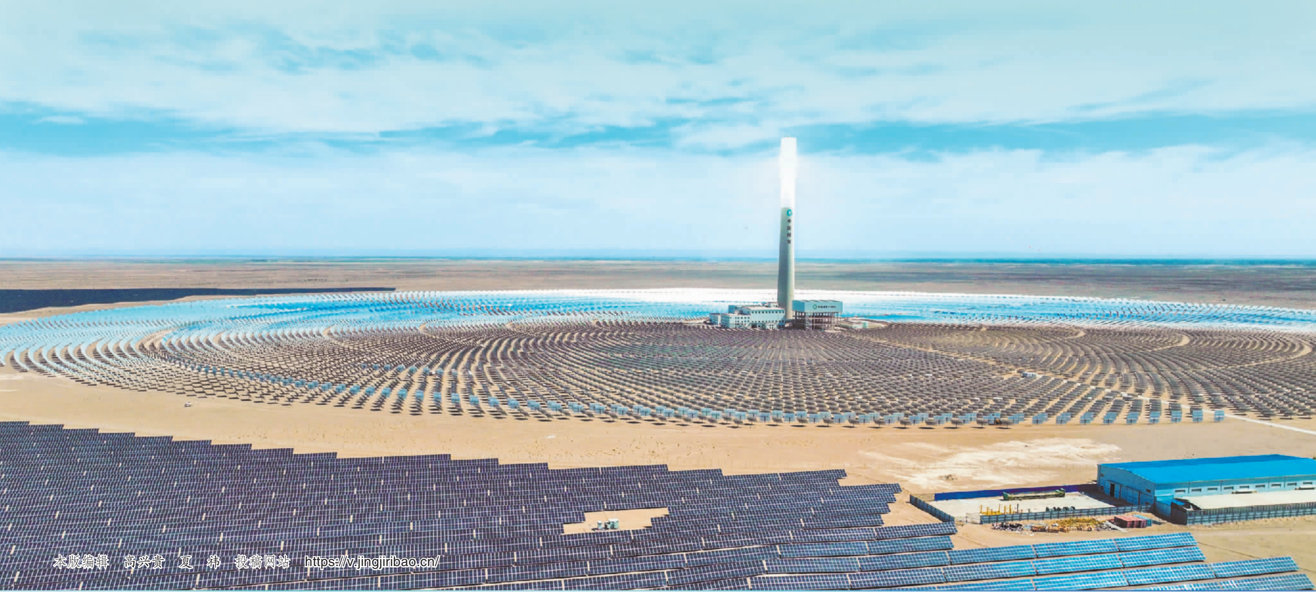
▼6月9日拍摄的甘肃省酒泉市金塔多能互补基地“10万千瓦光热+60万千瓦光伏”项目。该项目依托戈壁光能,可稳定输出绿电。