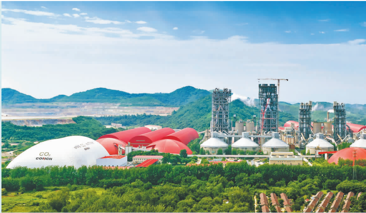
◀6月6日拍摄的位于安徽省芜湖市繁昌区的国家级绿色工厂示范项目芜湖海螺水泥有限公司超大型水泥熟料生产基地。6月17日是全国低碳日,截至2026年3月,我国已建成超过8000家国家级绿色工厂。