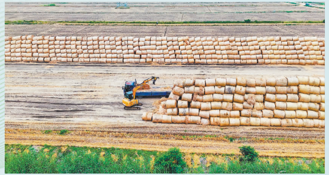
▲6月15日,江苏省连云港市海州区,在江苏农垦岗埠农场的秸秆集中堆放点,工作人员正将秸秆进行码垛。