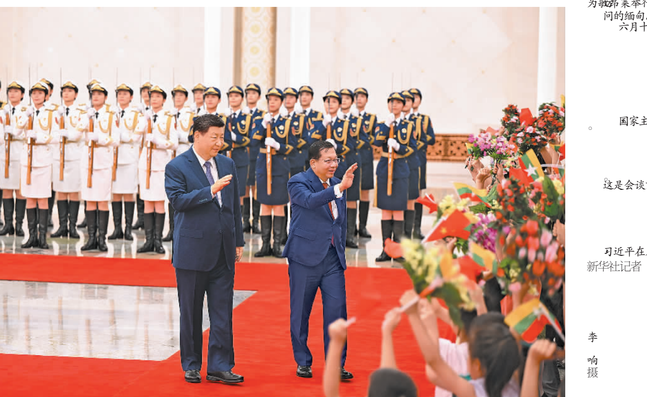
为敏昂莱举行欢迎仪式 问的缅甸总统敏昂莱举行欢迎仪式 六月十六日 国家主席习近平在北京人民大会堂同来华进行国事访问的

新华社北京6月16日电(记者马卓言)6月16日上午，国家主席习近平在北京人民大会堂同来华进行国事访问的缅甸总统敏昂莱举行会谈。 习近平指出，中缅胞波情谊深厚，建交76年来，始终风雨同舟、守望相助，共同倡导并践行和平共处五项原则，树立了国与国平等相待、互利共赢的典范。中国秉持亲诚惠容理念，将发展对缅关系置于周边外交重要位置。中国坚持不干涉内政原则，对缅友好政策面向缅甸全体人民，坚定支持缅甸维护主权和领土完整，支持缅甸新政府统筹发展和安全，找到符合国情、人民拥护的正确发展道路。今年是中国“十五五”开局之年，中方愿同缅方分享发展经验，共同打造政治上友好互信、发展上互利互惠、安全上协调互促、人文上交融互鉴的中缅命运共同体，为两国人民带来更多福祉，为地区和平与发展作出更多贡献。 习近平强调，中国是缅甸共享边界最长的邻居，是可以信赖的朋友和伙