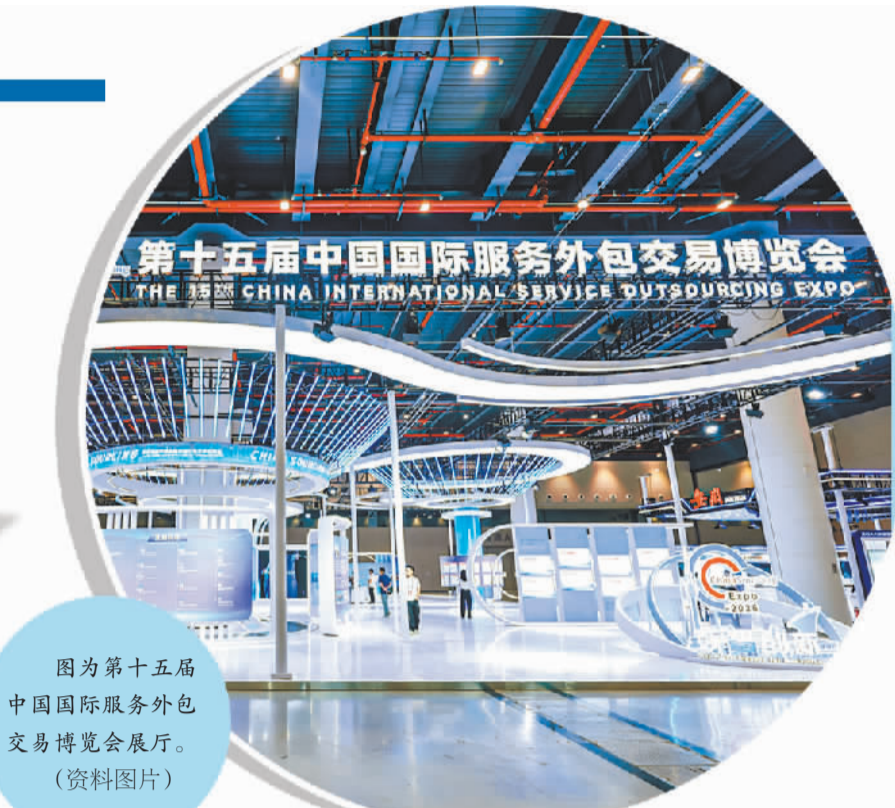
图为第十五届中国国际服务外包交易博览会展厅。（资料图片）

近年来，武汉坚持平台赋能、集群发展，构建起多层次、全覆盖的服务贸易载体体系。目前全市已建成文化、知识产权、地理信息、人力资源、语言服务5个国家级特色服务出口基地，以及4个省级服务外包示范园区，特色产业从“点上开花”走向“面上成