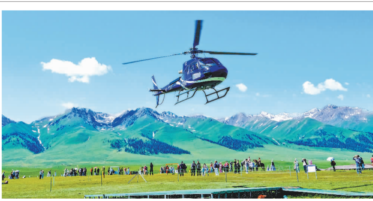
6月15日，游客在新疆维吾尔自治区伊犁哈萨克自治州新源县那拉提景区乘坐直升机“冲上云端”游览，领略壮美的草原风光。近年来，新源县立足当地文旅资源优势，发展滑翔伞、直升机等低空旅游项目，推动旅游业向多元业态方向发展。