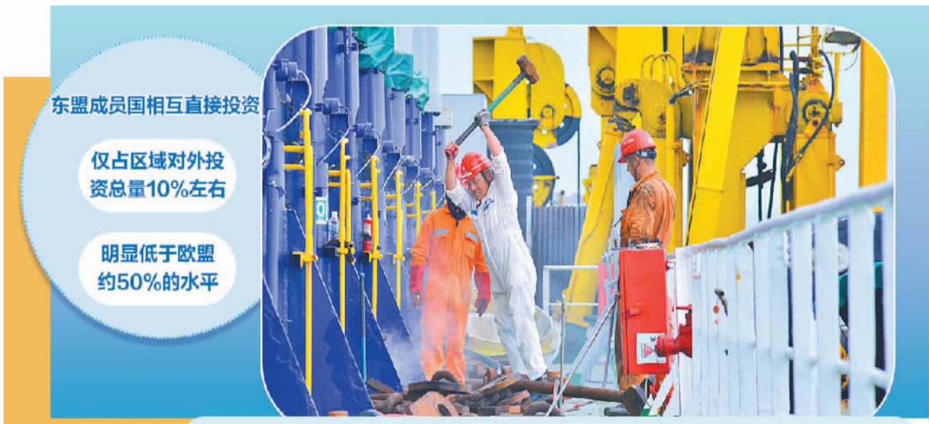
4月12日,在马来西亚雪兰莪州巴生,船员在“新海风”轮上工作。

想要破解当前发展困局,仅依靠传统关税减让手段已然难以维系,东盟必须从制度层面深化改革、破除壁垒。穆罕默德·哈桑提出,要进一步夯实自贸协定合作实效。如今各类自贸协定数量不断增加,但条款落地成效参差不齐,非关税壁垒成为阻碍商品自由流动的重要障碍之一。繁杂的通关流程、各国互不统一的技术标准、差异化的市场监管规则,大幅抬高了企业跨境经营成本。针对这一问题,东盟加快推进《东盟货物贸易协定》升级谈判,通过简化海关手续、统一技术法规与行业标准,着力打造规范透明、公平有序的区域市场。与此同时,中国—东盟自贸区3.0版等高水平自贸协定落地生效后,将数字经济、绿色发展、产业链互联互通纳入合作范畴,持续深化双方在云基础设施、人工智能、金融科技、绿色设备等前沿领域的合作,推动供应链深度融合。