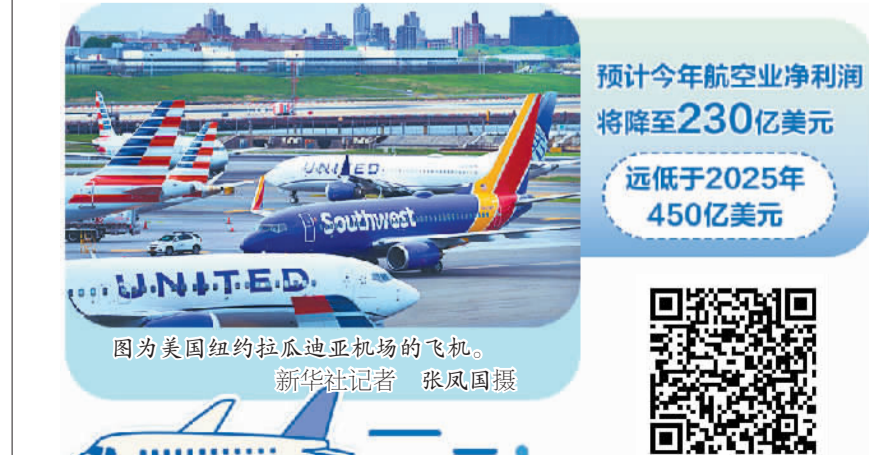
图为美国纽约拉瓜迪亚机场的飞机。