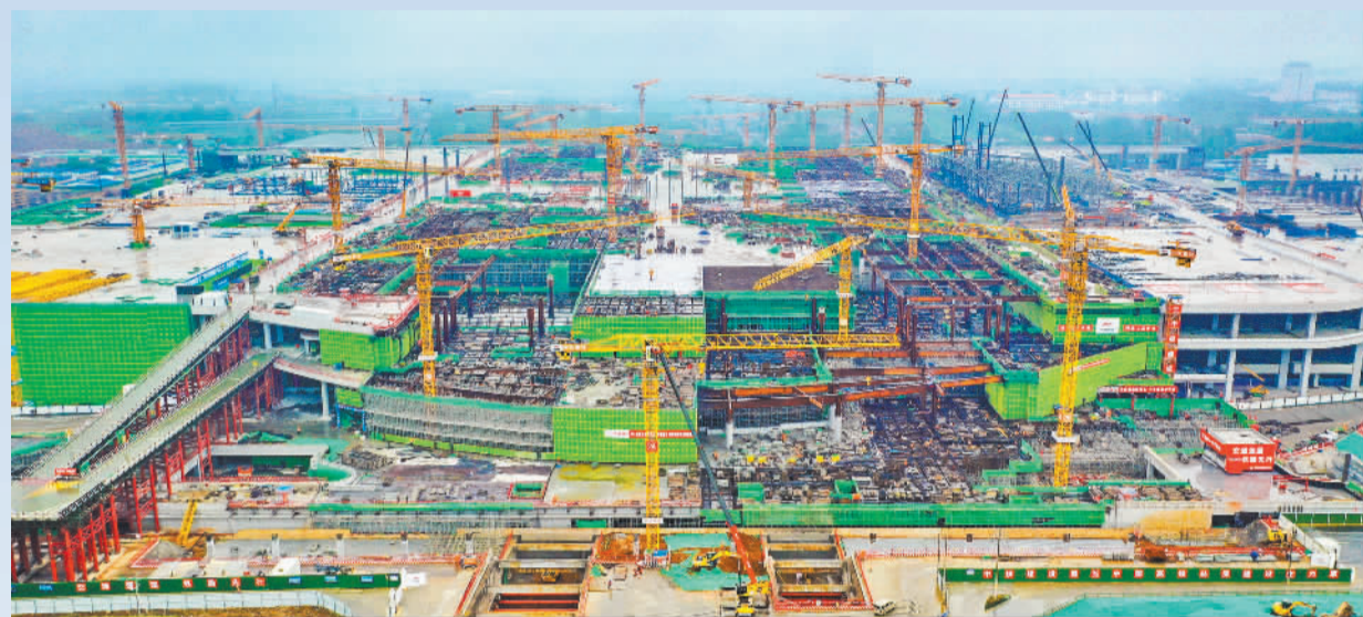
▼5月19日,由中铁建设承建的北沿江高铁南京北站建设正酣。南京北站启用后将助力提升南京都市圈中心城市辐射能力。