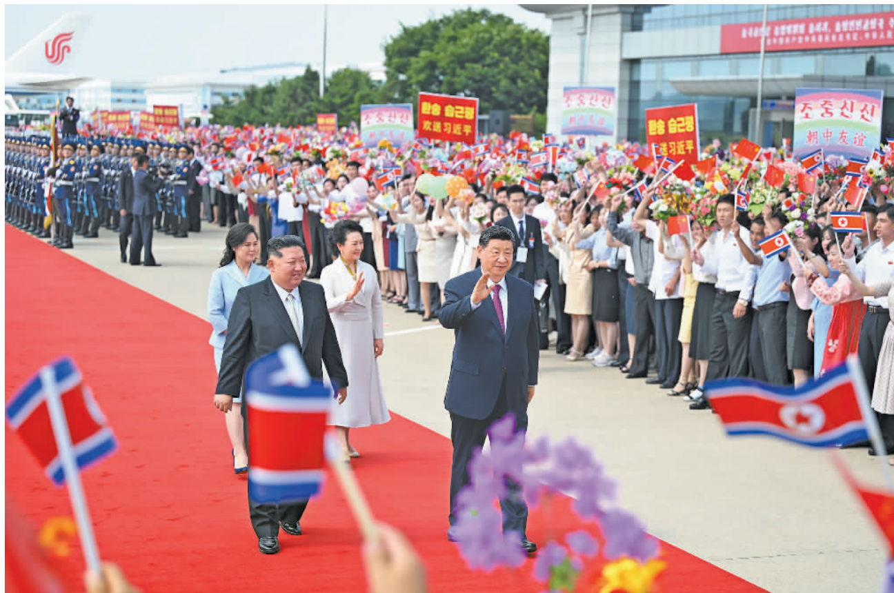
当地时间6月9日下午,中共中央总书记、国家主席习近平结束对朝鲜的国事访问离开平壤。朝鲜劳动党总书记、国务委员长金正恩和夫人李雪主到机场送行,为习近平和夫人彭丽媛举行隆重的欢送仪式。