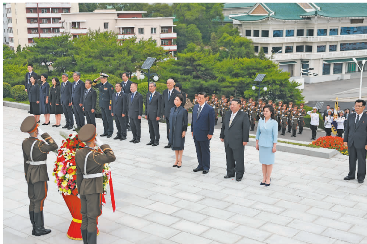
当地时间6月9日上午,正在朝鲜进行国事访问的中共中央总书记、国家主席习近平和夫人彭丽媛参谒中朝友谊塔。朝鲜劳动党总书记、国务委员长金正恩和夫人李雪主陪同。