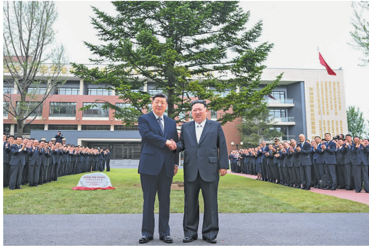
当地时间6月9日上午,中共中央总书记、国家主席习近平在朝鲜劳动党总书记、国务委员长金正恩陪同下,参访位于平壤的朝鲜劳动党中央干部学校。这是习近平和金正恩在教学楼之间的林地上共同种下一株楸树后握手合影。