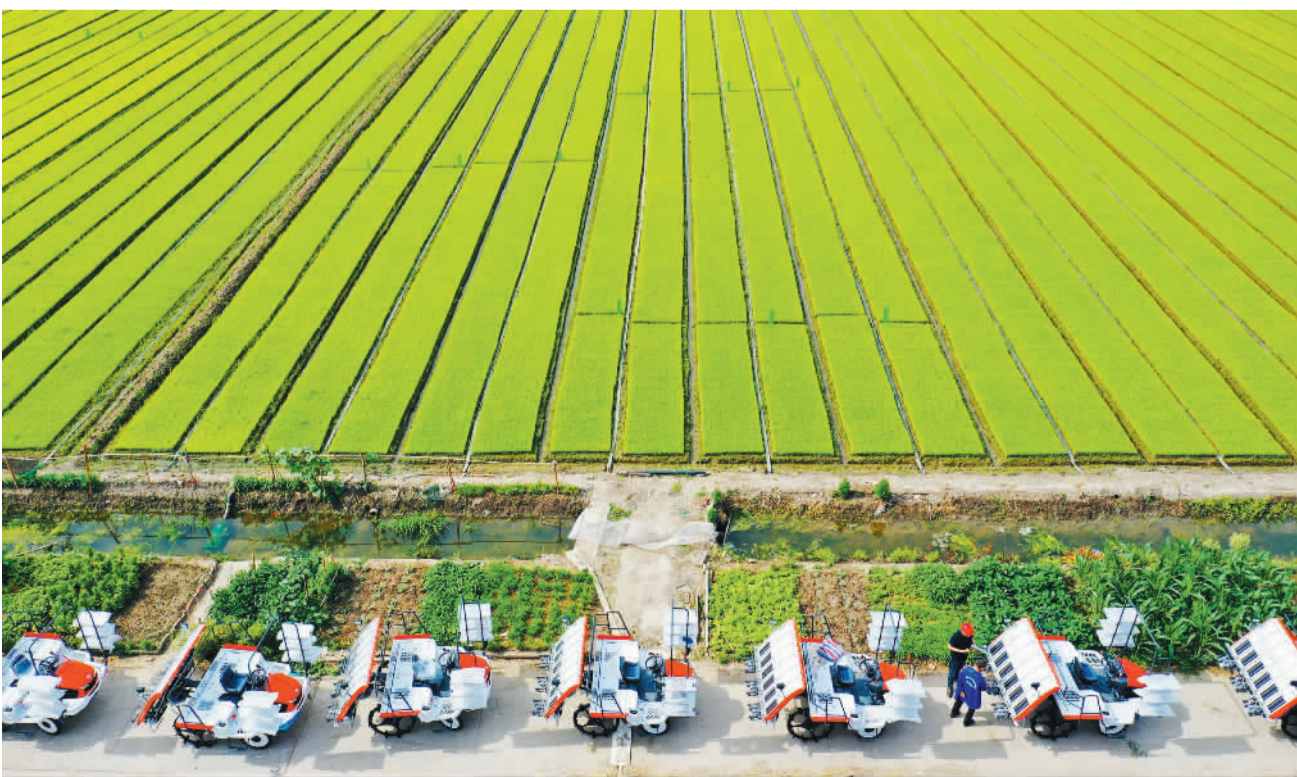
6月5日,江苏省淮安市洪泽区农业农村局组织专人将9台新型插秧机送到双沟镇山阳村育秧大户田间地头,为水稻机械化移栽提供保障。据悉,财政惠农补贴提高了农户购买现代农业机械的积极性,加快了智能农机的推广和应用。