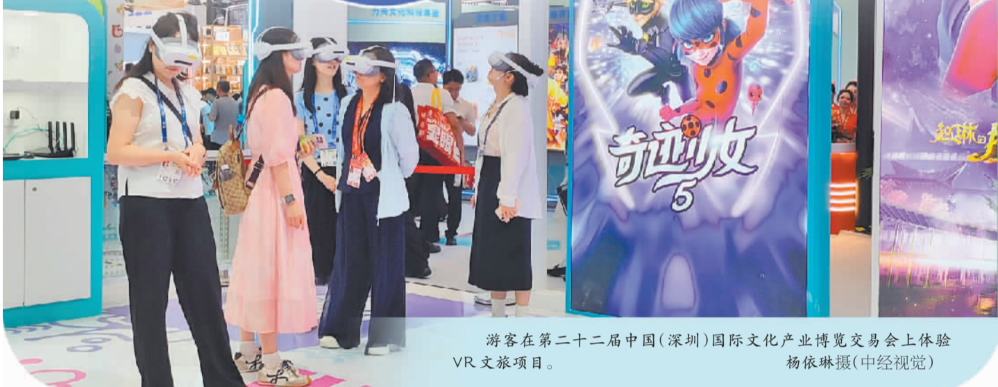
游客在第二十二届中国(深圳)国际文化产业博览交易会上体验VR文旅项目。

截至6月1日,深圳市立春影业有限公司参与出品的电影《给阿嬷的情书》总票房突破14.48亿元,居2026年度票房榜第二位,成为今年国产电影的现象级作品。 “我们始终坚持以微小视角为切口,深耕广东本土故事,努力在电影市场找到属于我们的生态位。”《给阿嬷的情书》导演、编剧蓝鸿春说。 这部影片的成功,是深圳打造高质量文化强市的一个缩影。最新数据显示,2025年,深圳规模以上文化及相关产业企业超过3900家,实现营业收入15140.07亿元。其中,文化核心领域实现营业收入11481.43亿元,增长20.2%,产业质效稳步提升。