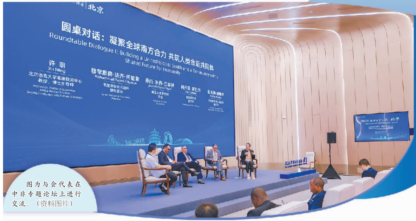
图为与会代表在中非专题论坛上进行交流。

老文明的重要发源地，各自的语言习俗、历史文脉、价值理念和文化遗产，都是联通民众情感的天桥。哈吉·萨尔·费耶说，“地方政府是中非民间交流落地的关键载体，也是落实中非合作论坛各项部署的重要抓手。非洲城市可借鉴中国在城市规划、基础设施建设、数字化转型、脱贫攻坚、产业升级等领域的成熟经验，推动城市可持续发展。”