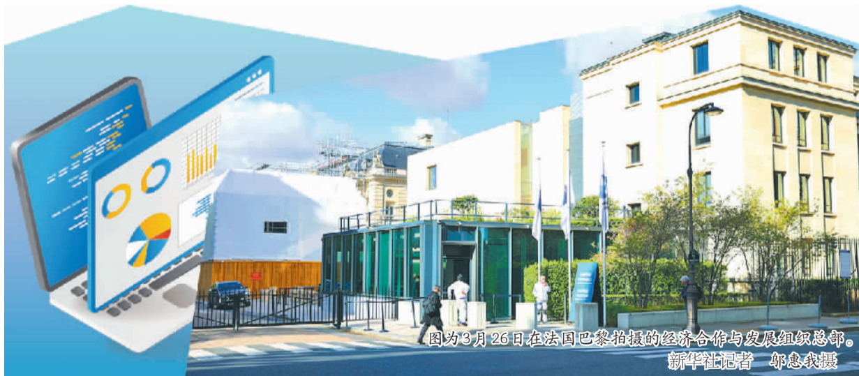
图为6月26日在法国巴黎拍摄的经济合作与发展组织总部。

经济合作与发展组织(OECD)近期发布研究报告指出，其成员国普遍面临严重公共财政压力，尽管各国大多采取了财政节约措施，但相较于公共财政所面临的挑战，这些措施的效力仍显不足，恢复公共财政、建设高效政府，应当成为经合组织国家财政改革方向。报告显示，89%的经合组织国家2025年至2026年间在社保和医保领域采取了财政节约措施；77%的经合组织国家2025年至2026年间在政府运营领域采取了财政节约措施。