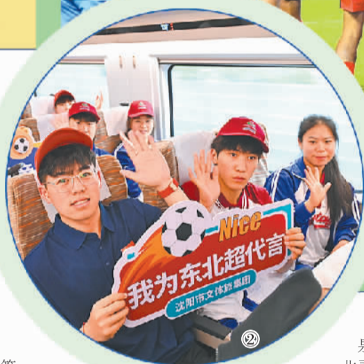
图② 中国铁路哈尔滨局集团有限公司哈尔滨客运段，为观看“东北超”比赛的球迷打造的主题车厢。原勇摄(新华社发)

近日,由辽宁、吉林、黑龙江、内蒙古三省一区联手打造的“东北超”正式开赛。作为全国首个跨省区城市足球超级联赛,“东北超”凭借覆盖超1亿人口的影响力,点燃了足球热情,带火了文旅旅商。