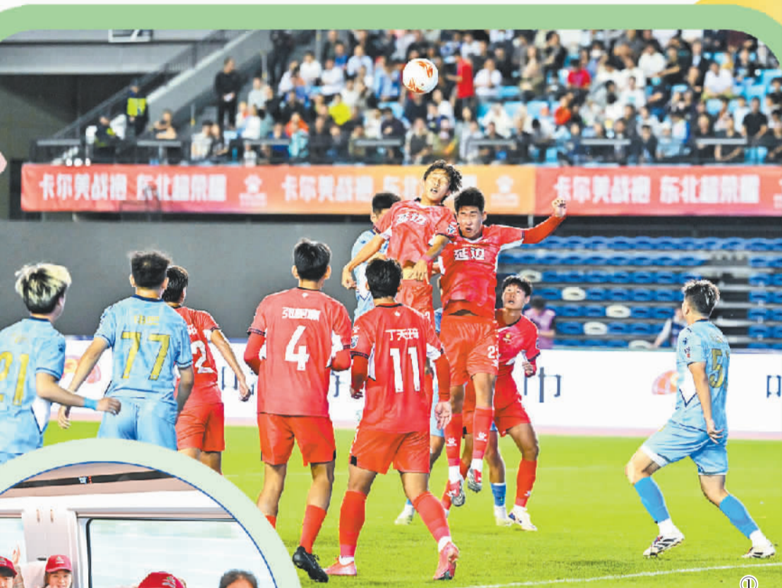
图① “东北超”揭幕战呼和浩特队0比0战平延边队。