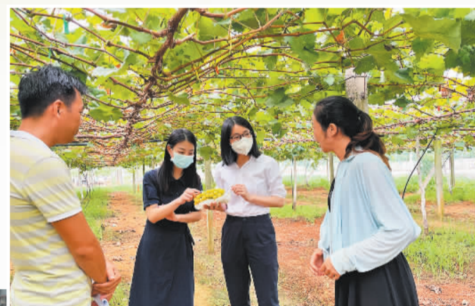
广西融资担保集团客户经理对“三农”类客户做保后调研

业人数超100万人。户，以金融赋能推动科技成果转化，为广西产业创新升级筑牢金融根基。