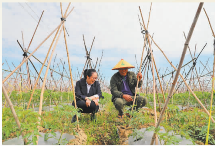
广西融资担保集团客户经理对“番茄保”产品客户做保后调研