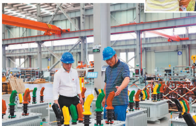
广西融资担保集团客户经理对一家专精特新企业做保前尽职调查

截至2026年5月末，集团在保余额约636亿元，在保户数约8万户，较成立之初分别增长4倍和22倍；政策性担保业务“支小支农”在保余额占比超99%，单户500万元及以下在保余额占比超78%；平均担保费率低于1%，有效降低经营主体融资成本，切实为经营主体减负纾困。6年来，累计为21万户经营主体提供担保金额超2500亿元，累计降低综合融资成本超37亿元，累计带动经营主体贡献税收超220亿元，累计带动