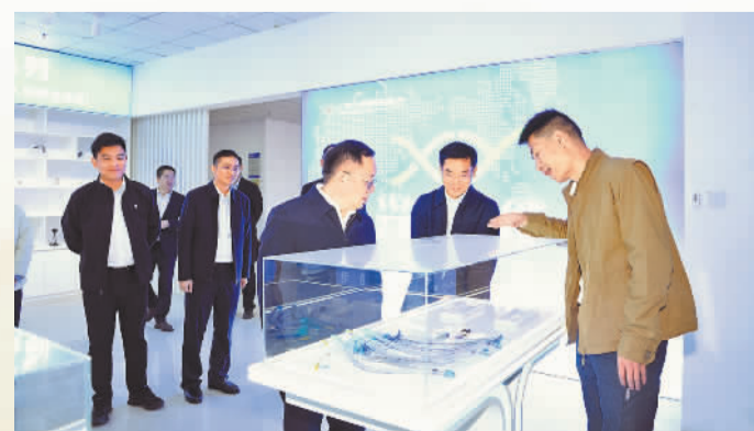
广西融资担保集团到百色市调研在保科创企业运营和融资情况

政府性融资担保是连接财政与金融、疏通中小微企业和“三农”融资堵点的关键政策性工具，是引导金融活水精准灌溉实体经济、助力区域经济稳健发展的重要支撑。为落实国家建设完善政府性融资担保体系的工作要求，2020年6月，广西融资担保集团有限公司正式挂牌成立。集团始终坚守政策性、普惠性、专业性定位，全面释放财政金融协同效能，以担保之力稳经营主体、促就业增收、惠民生福祉，为八桂大地实体经济高质量发展注入持久动能。