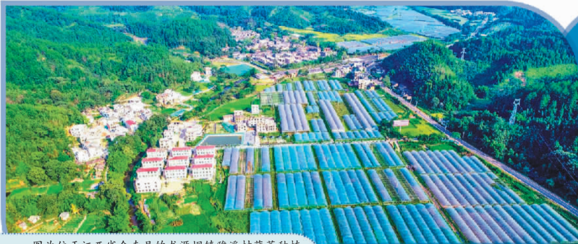
图为位于江西省全南县的龙源坝镇雅溪村蔬菜种植基地。截至目前,赣州已认定超100个粤港澳大湾区“菜篮子”生产基地。