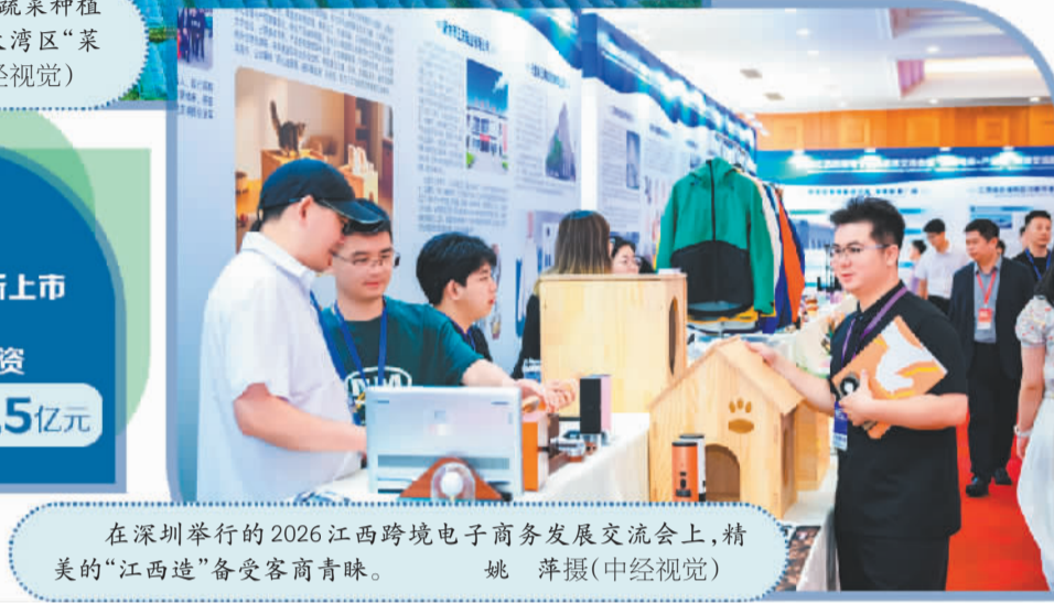
在深圳举行的2026江西跨境电商发展交流会上,精美的“江西造”备受客商青睐。