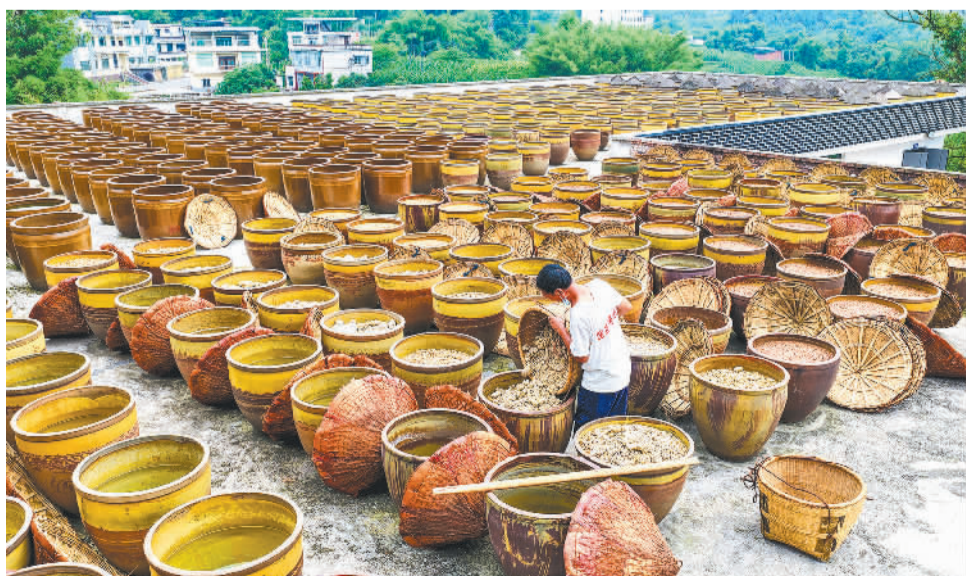
近日,在四川省泸州市合江县先市永生酿造厂,工人抓住初夏时节气候投放今年最后一批入缸的酱料。该县利用赤水河畔独特的生态资源发展传统酱油酿造业,带动当地群众就业、助力乡村全面振兴。

近日,总部在广东的洋臣木业(家具)集团旗下品牌——A家家居出口家具首次通过赣州国际陆港铁路运输顺利抵达蛇口港并成功放行。为保障首柜顺利出口,赣州国际陆港主动靠前、全程跟进服务,联动赣州海关加急核检出口家具类单证资料,联合铁路部