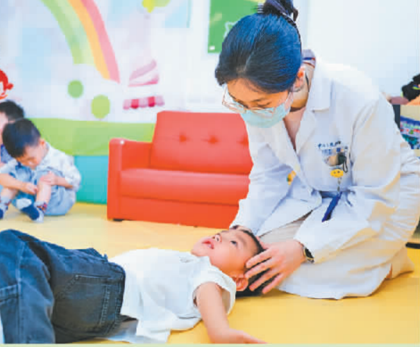
深圳市福田区华红社区健康服务中心的医生为托育点儿童进行推拿。