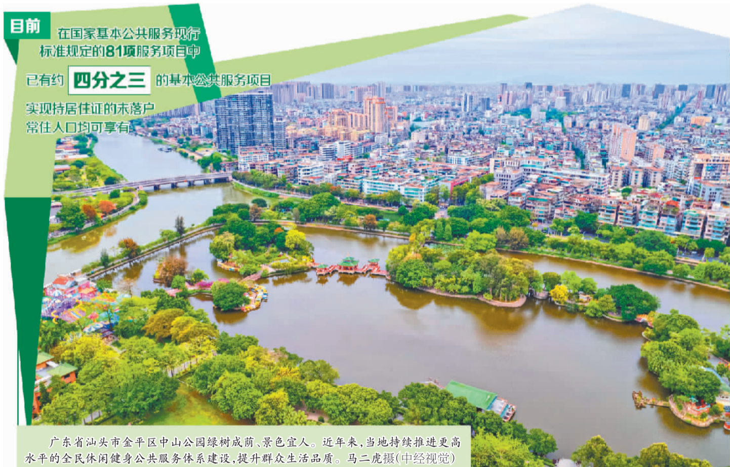
广东省汕头市金平区中山公园绿树成荫、景色宜人。近年来,当地持续推进更高层次的全民休闲健身公共服务体系建设,提升群众生活品质。

习近平经济思想研究中心主任史育龙认为,《实施意见》的一系列部署抓住了流动人口家庭最牵挂的问题,在制度设计上既考虑了现实需求,也注重服务的均等化和政策的可持续性,能够将基本公共服务更加精准有