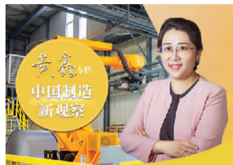
□ 本报记者 纪文慧 顾阳

摩尔定律从提出到成为行业共识,历经整整10年。技术突破从来不是单打独斗,华为提出韬(τ)定律,离不开全产业链伙伴的携手探索。放眼未来,行业挑战越发复杂艰巨,单凭一家企业难以攻克所有技术难题。半导体产业已迈入协同创新的新阶段,聚力同行、开放协作,既是半导体行业破局的必然选择,也是中国制造迈向高端的必由之路。