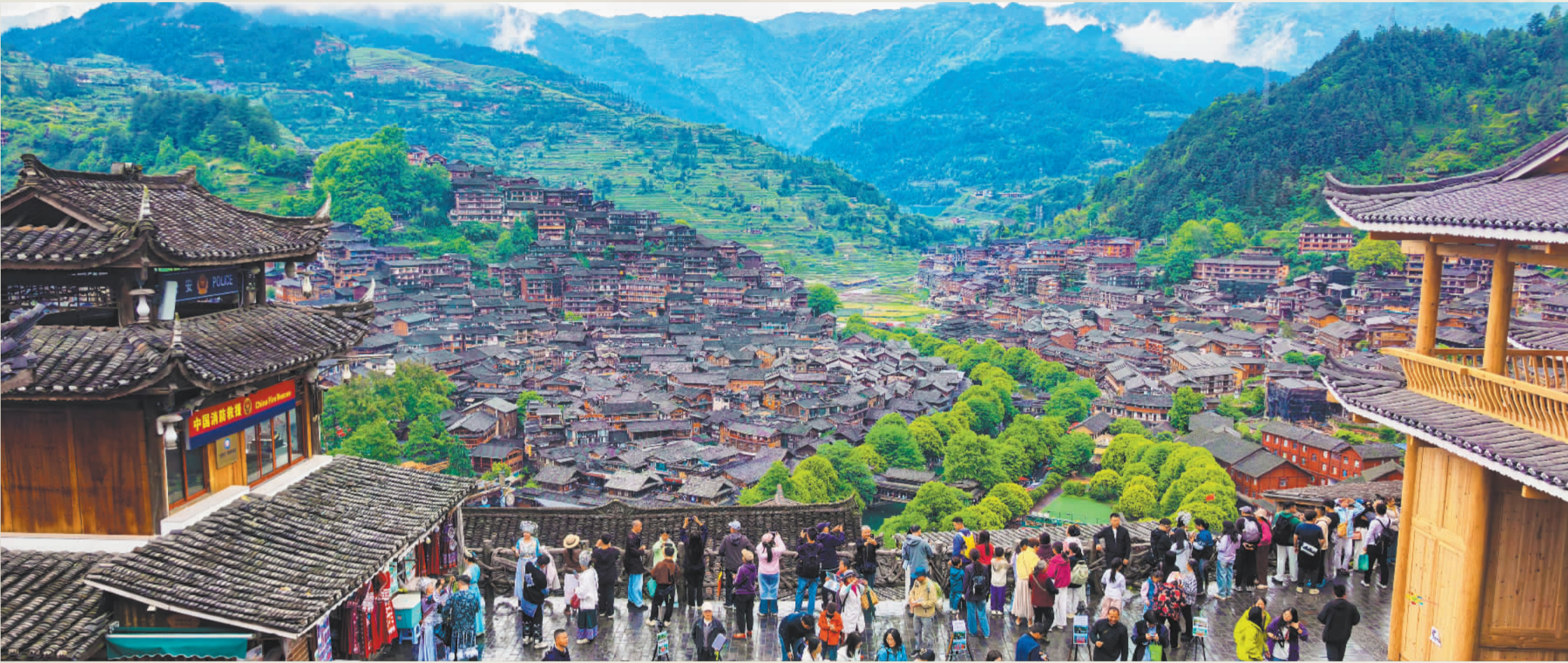
▲贵州省黔东南州剑河县久仰镇基佑村依托良好的生态资源，大力发展生态旅游、康养度假、特色民宿等产业，让村民在家门口吃上“生态饭”，实现生态保护与经济发展双赢（摄于2022年5月8日）。