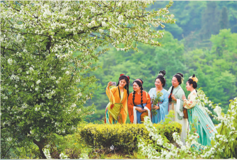
▼4月19日，贵州省黔东南州黄平县浪洞镇永康村云雾山，游客身着汉服在茶园里打卡。日前，全新“村字号”IP“贵州·村影”在此启动，将茶山变为光影艺术与乡土风情交融的舞台。