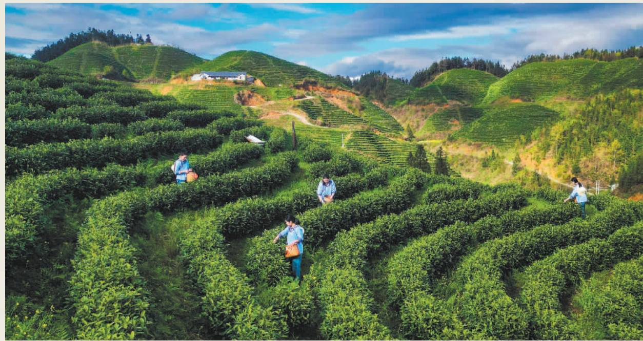
▼3月31日，贵州省黔东南州榕江县崇义乡大塘村青白茶种植基地，茶农在采茶。榕江县依托高山生态优势，打造规模化生态茶园，带动村民实现就业增收。