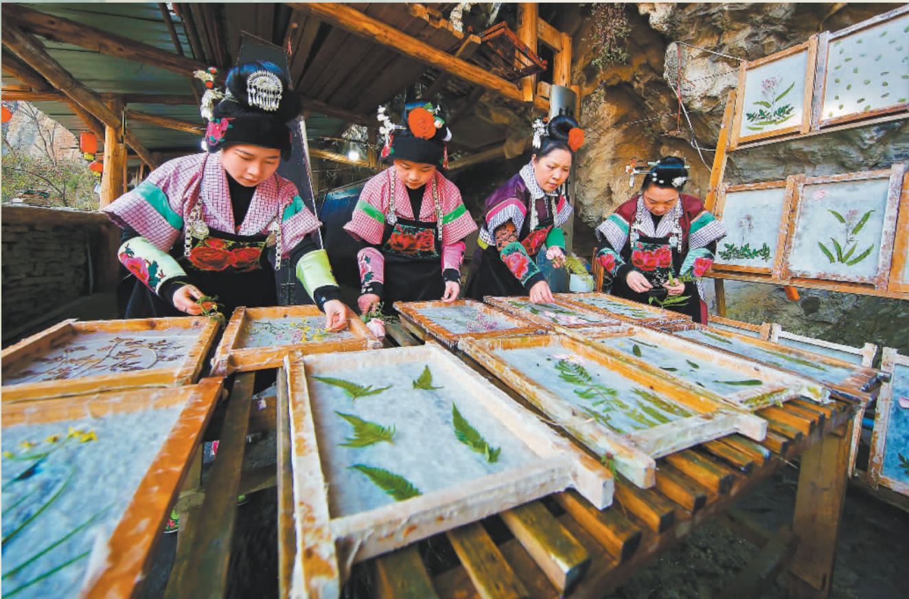
▲1月14日，苗族村民在贵州省黔东南州丹寨县南皋乡石桥村古法造纸作坊制作花草纸。依托千年古纸制作技艺，当地积极探索“非遗+旅游”融合模式，让古老的造纸术在新时代绽放光彩。