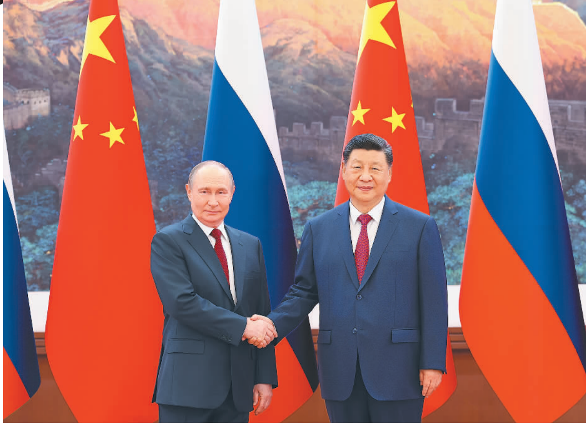
5月20日上午，国家主席习近平在北京人民大会堂同来华进行国事访问的俄罗斯总统普京举行会谈。