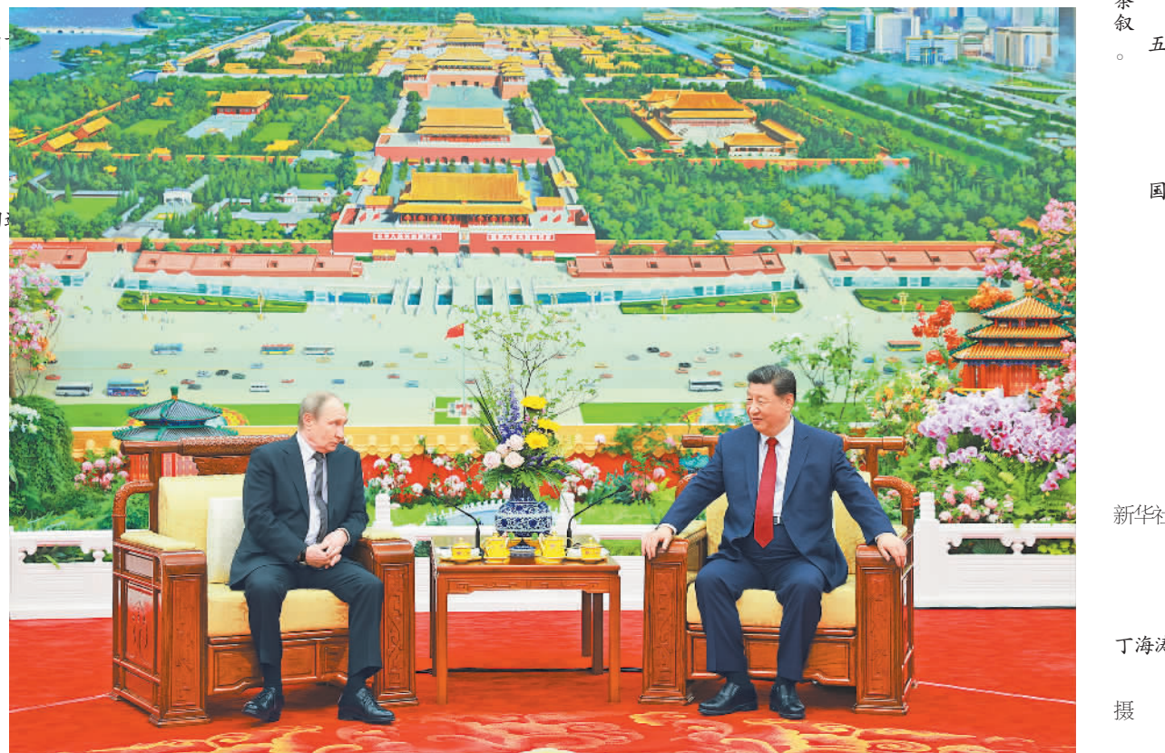
新华社北京5月20日电(记者孙奕)5月20日晚，国家主席习近平在北京人民大会堂同俄罗斯总统普京举行茶叙。习近平指出，多年来，我同普京总统保持频繁交往，共同引领中俄新时代

全面战略协作伙伴关系持续走深走实，推动两国睦邻友好更加深入人心，开创了相互尊重、公平正义、合作共赢的新型大国关系范式，为变乱交织的世界持续注入宝贵的稳定性。今天我同普京