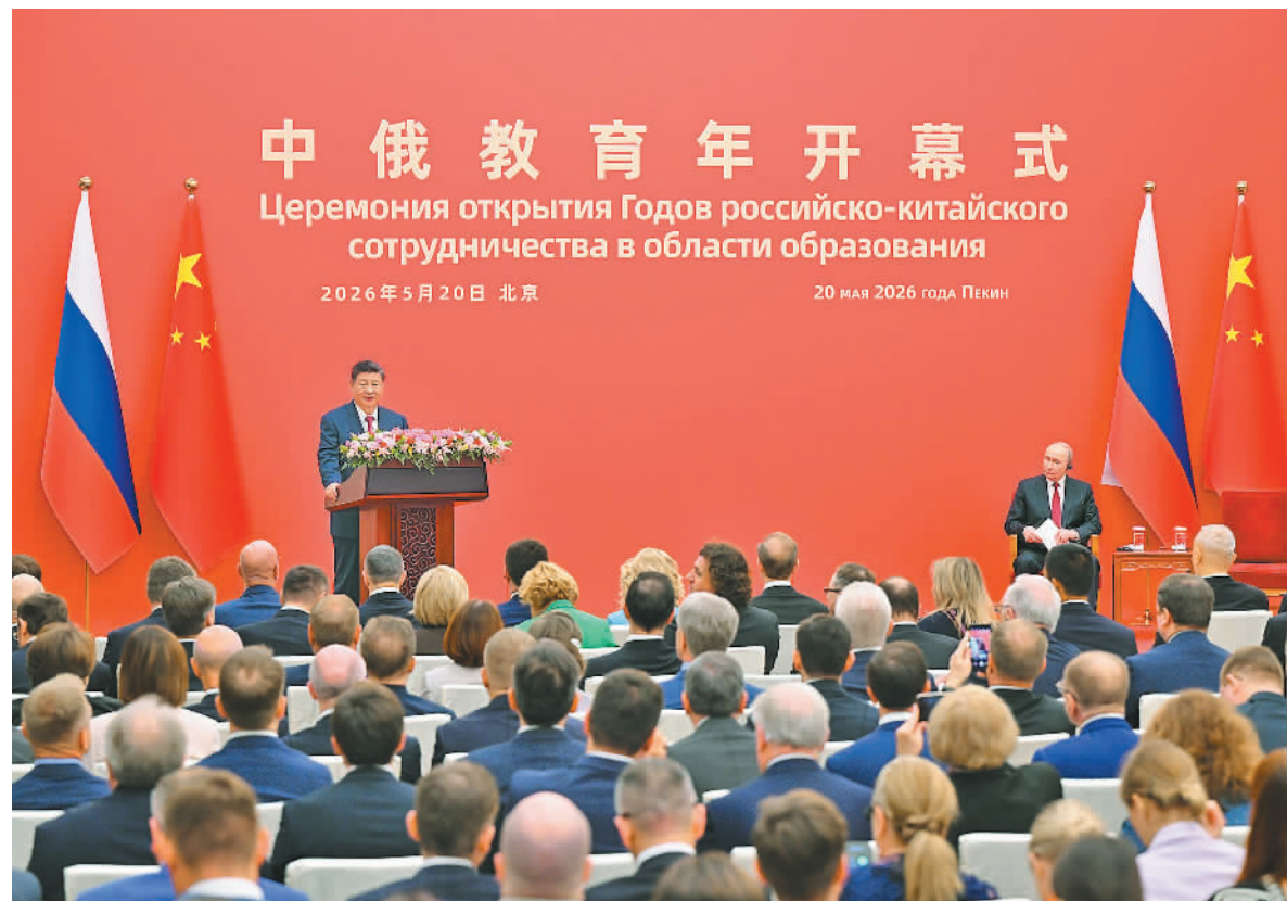
新华社北京5月20日电(记者杨依军、温馨)5月20日下午，国家主席习近平同俄罗斯总统普京在北京人民大会堂共同出席“中俄教育年”开幕式。两国元首在热烈的掌声中同步

入会场。习近平首先发表致辞。习近平指出，今年是中俄战略协作伙伴关系建立30周年和《中俄睦邻友好合作条约》签署25周年。在这样一个具有特殊意义的