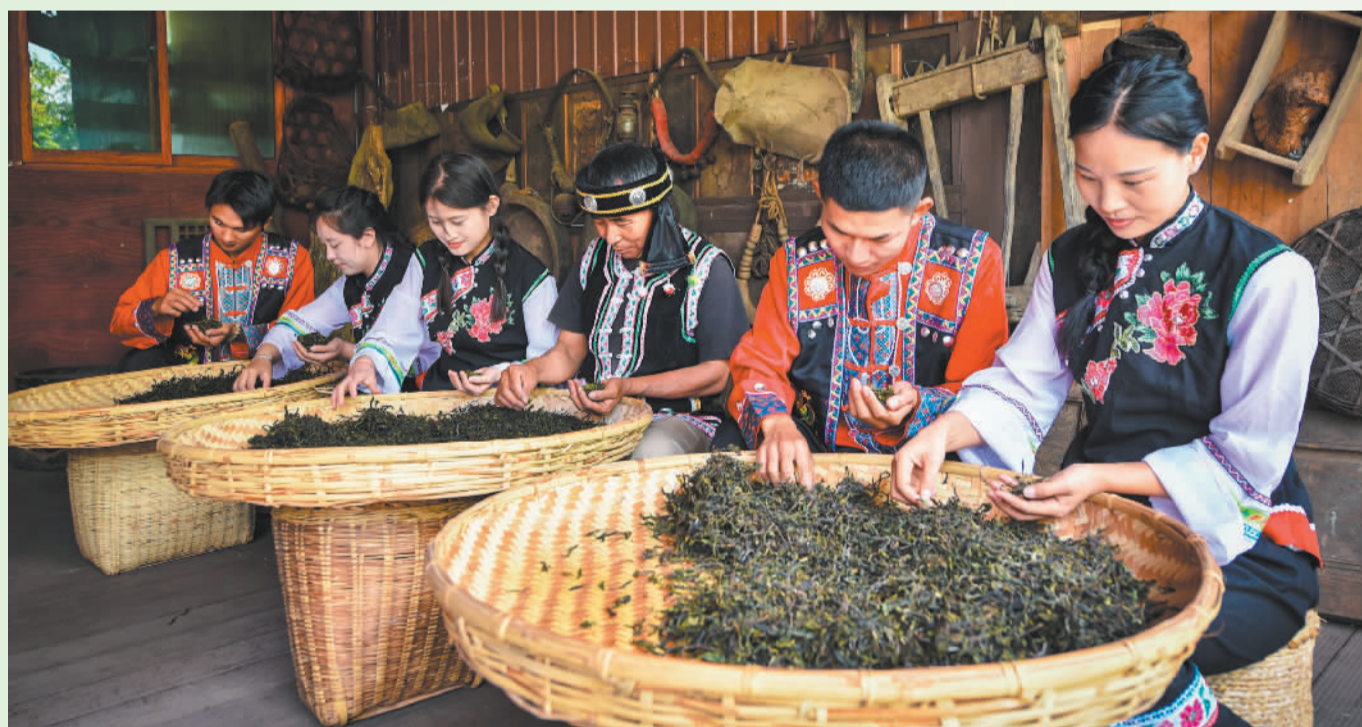
▼4月20日拍摄的云南省临沧市双江县荣康达乌龙茶庄园。这里集茶叶种植加工、旅游休闲度假、茶文化精品酒店于一体，是当地茶旅融合的代表。