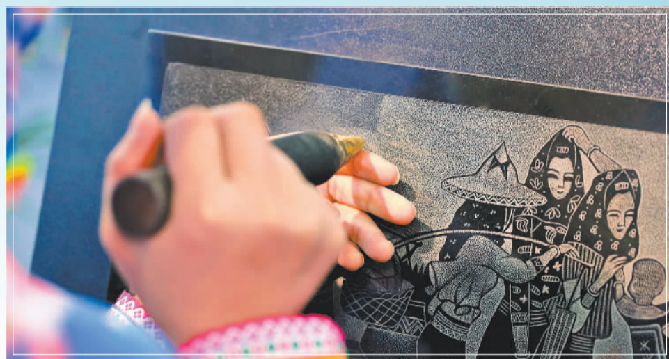
▼2020年3月,工作人员在制作惠安石雕(影雕)。