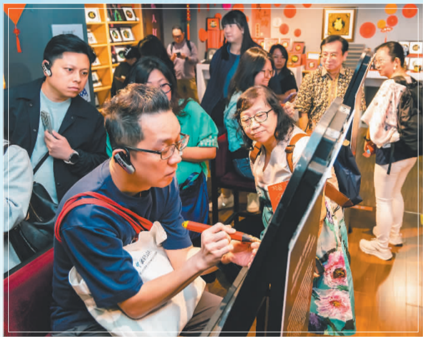
▼2025年10月,游客在惠和石文化园内参观。该文化园是集石雕艺术展示、艺术创作、文化交流、旅游休闲与教育学习为一体的非遗传承基地和综合性文化旅游景区,年接待游客达50万人次。