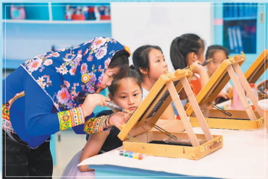
▲2019年4月,学生在老师的指导下体验影雕制作。“影雕工艺”已成为当地学校的特色项目,受到众多学生的欢迎。