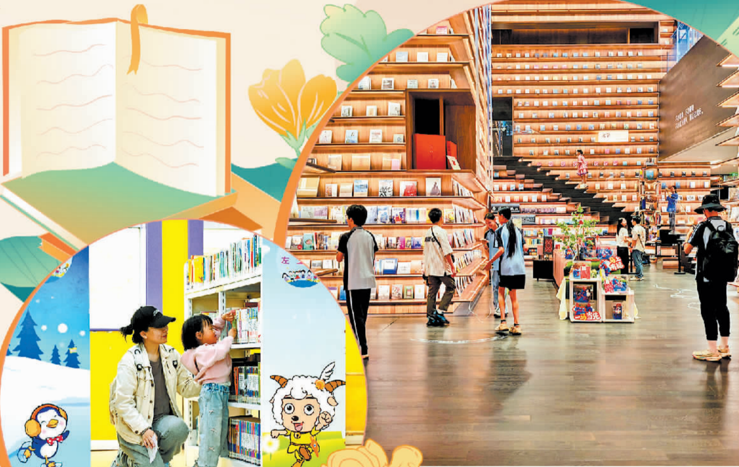
消费者在广西南宁漓江书院未来方舟店选购图书。

走进书城，记者立刻被一层特设的非遗展示区吸引。这块专门划出的区域陈列着定瓷、面塑等非遗作品，展现出传统文化有