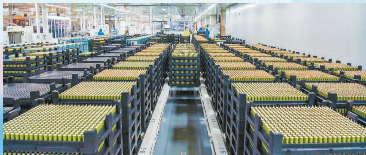
▼2023年9月7日,浙江省金华东阳市横店镇东磁高新产业园区锂电池自动化生产车间,智能搬运车在生产车间搬运材料。