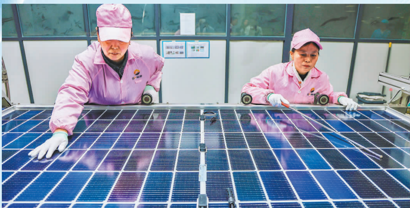
◀2月25日,位于金华市金东区的浙江格普光能科技有限公司生产基地,员工在赶制海外订单。