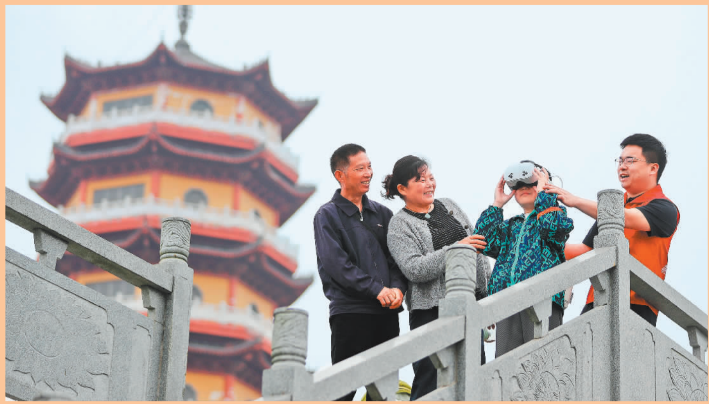
▲4月6日,湖北省荆门市沙洋县纪山镇纪山寺,游客戴着VR眼镜,沉浸式体验楚简制作过程。各景区数字化更新持续进行,为游客提供文化消费新场景。