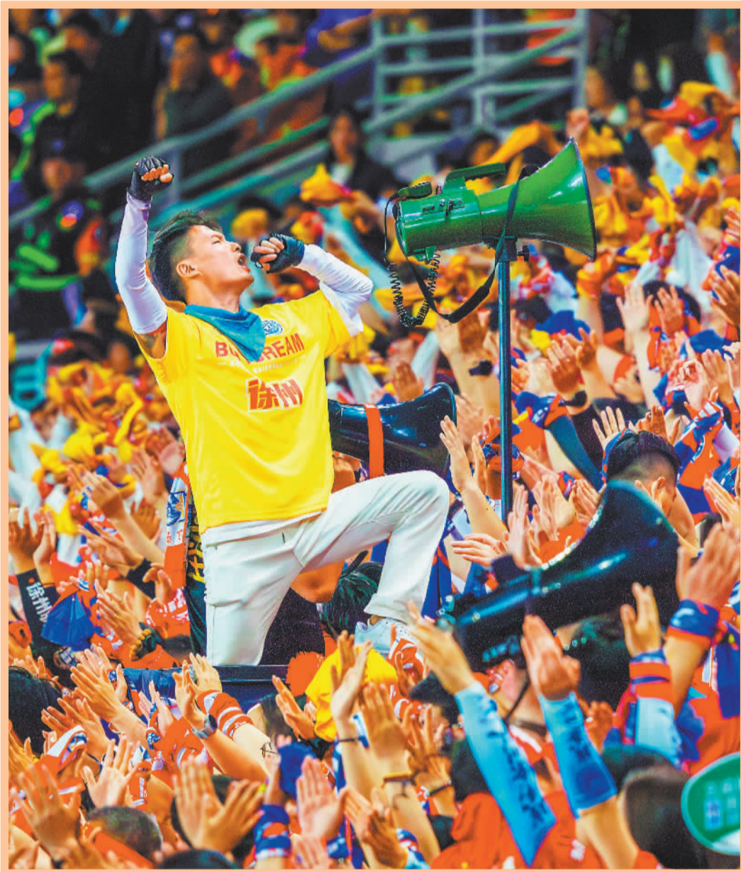
▲5月9日,2026江苏省城市足球联赛第五周赛事拉开帷幕,徐州队在主场奥体中心迎战宿迁队,观众在现场为球队加油助威。火热的体育赛事点燃消费热情,赛事“流量”正转化为经济“增量”。