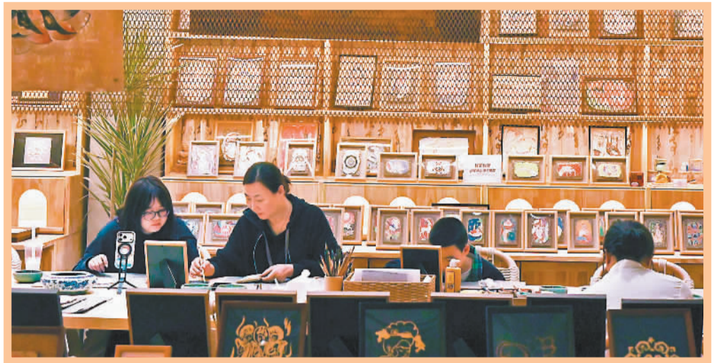
▼4月10日,市民在江西省宜春市万载县康乐街道西门社区山和樾城市书房内阅读。当地打造10分钟阅读生活圈,让城乡居民拥有便利、舒适的阅读空间。