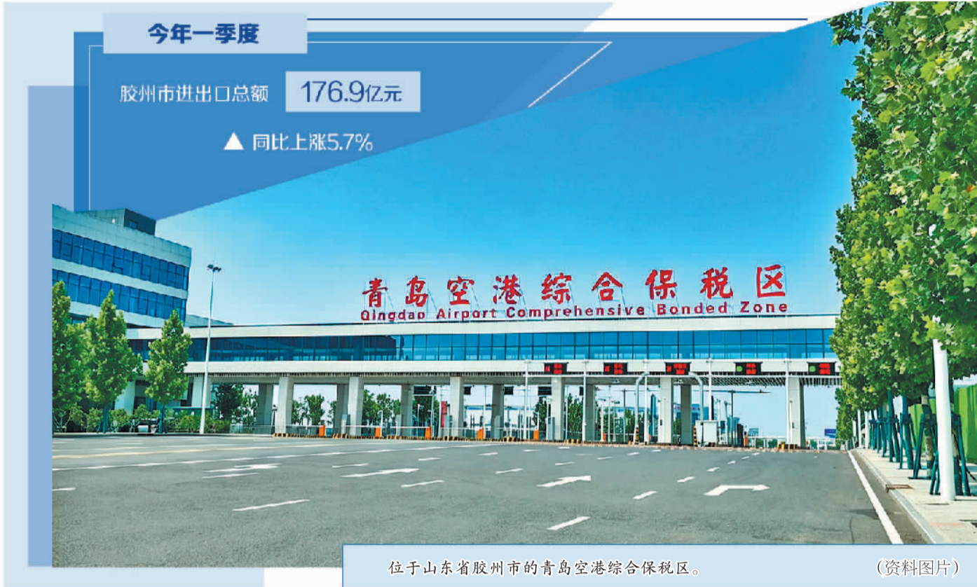
位于山东省胶州市的青岛空港综合保税区。