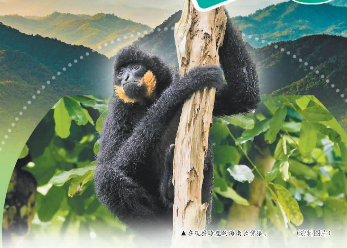
▲在观察瞭望的海南长臂猿。