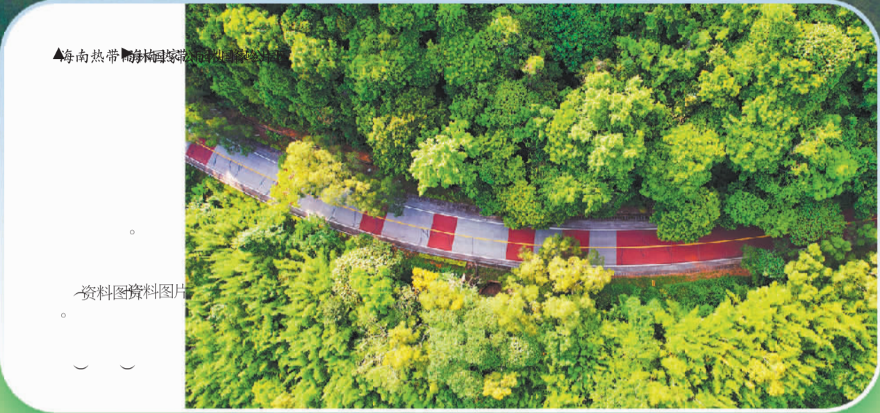
▲海南热带雨林国家公园