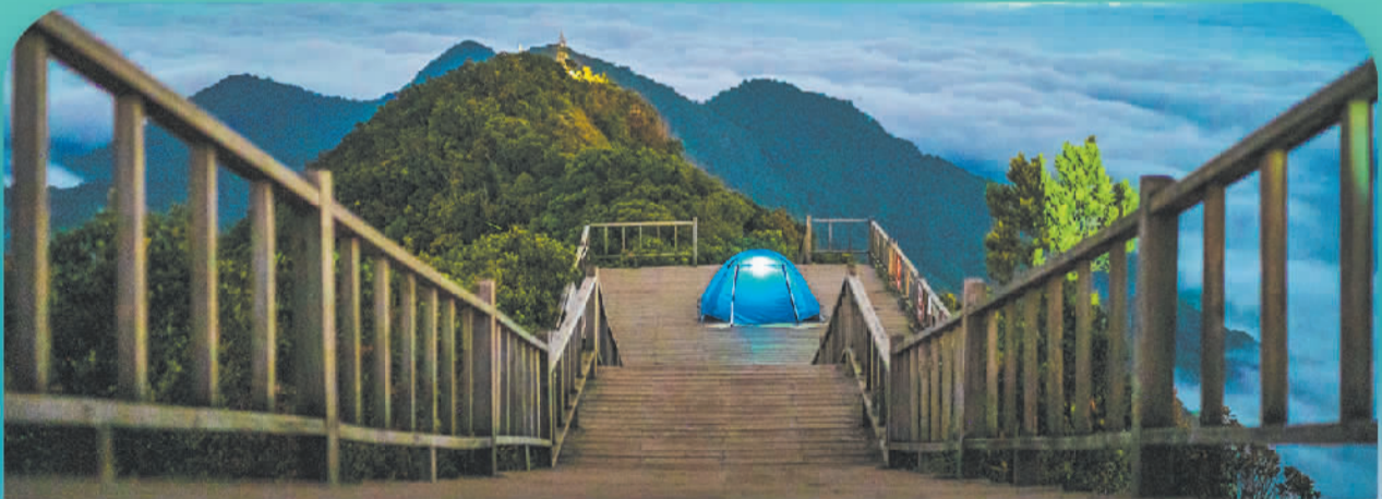
▲海南热带雨林国家公园尖峰岭片区。