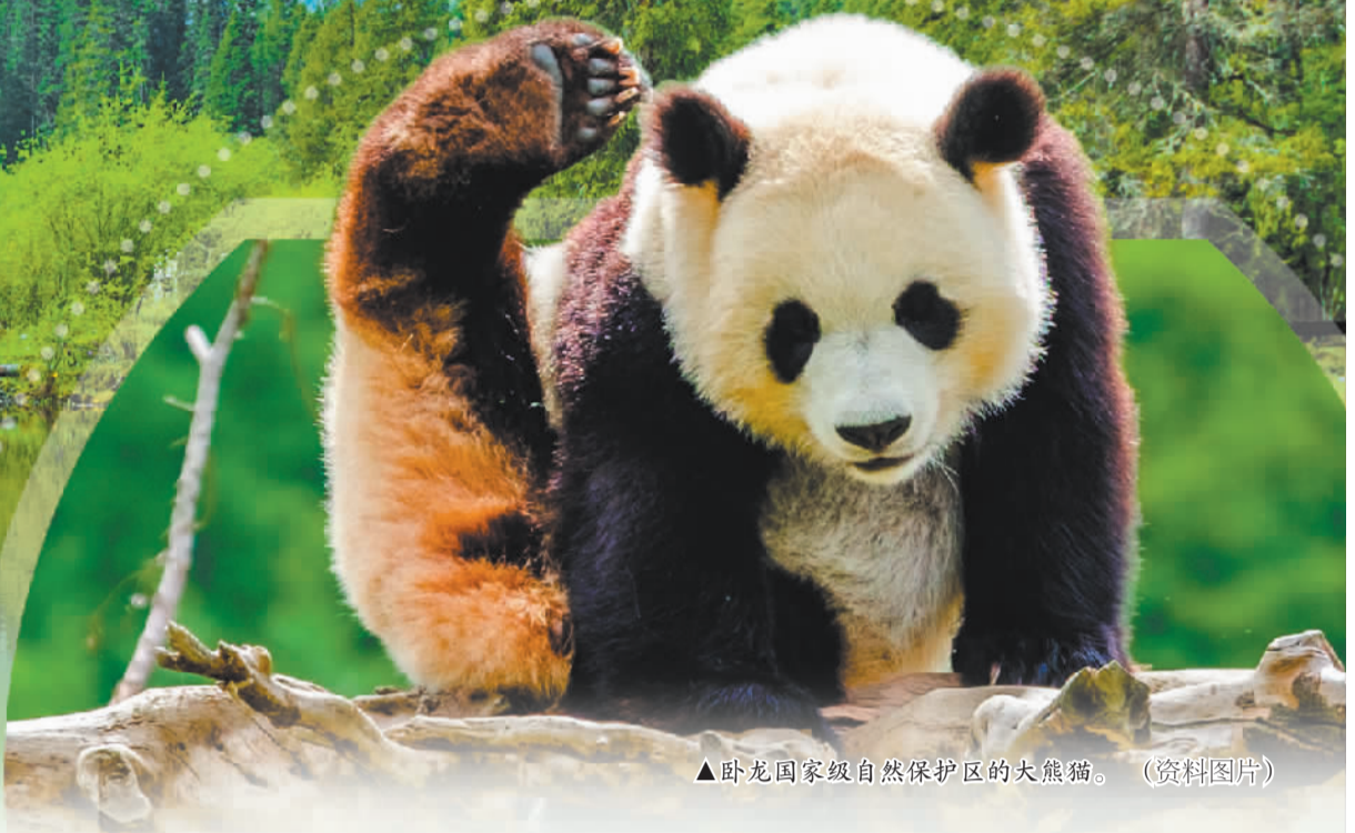
▲卧龙国家级自然保护区的大熊猫。(资料图片)