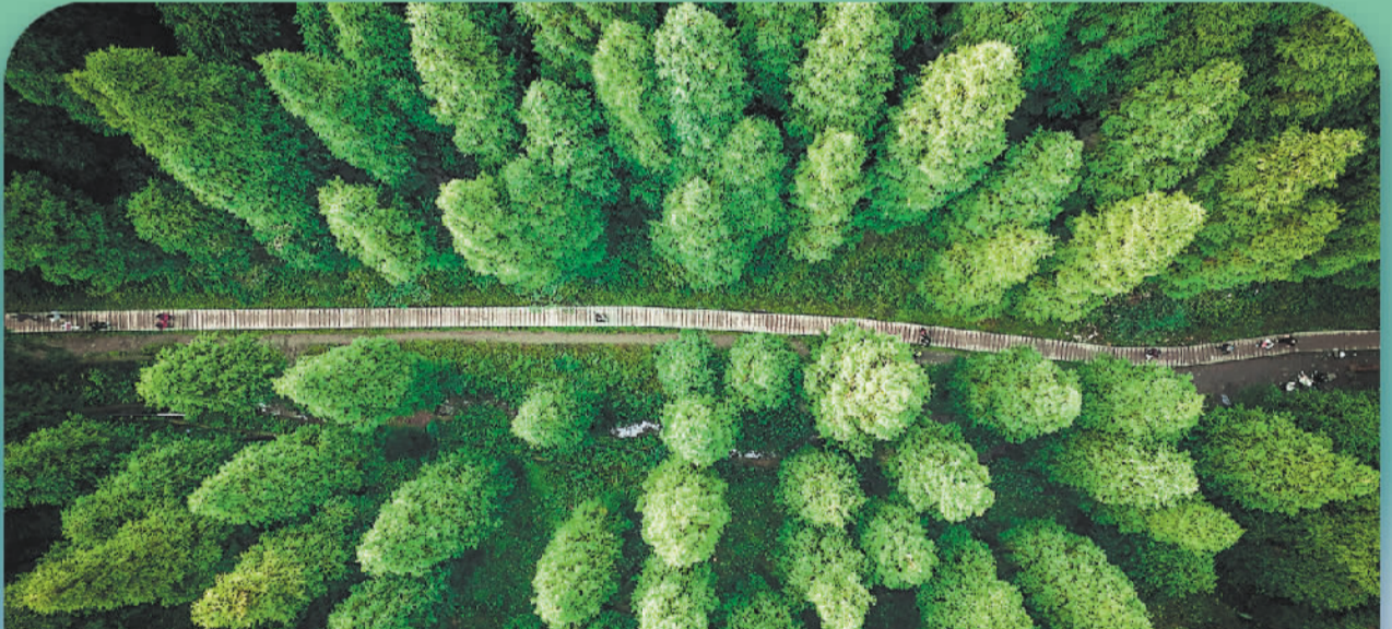
▲俯瞰大熊猫国家公园步道。