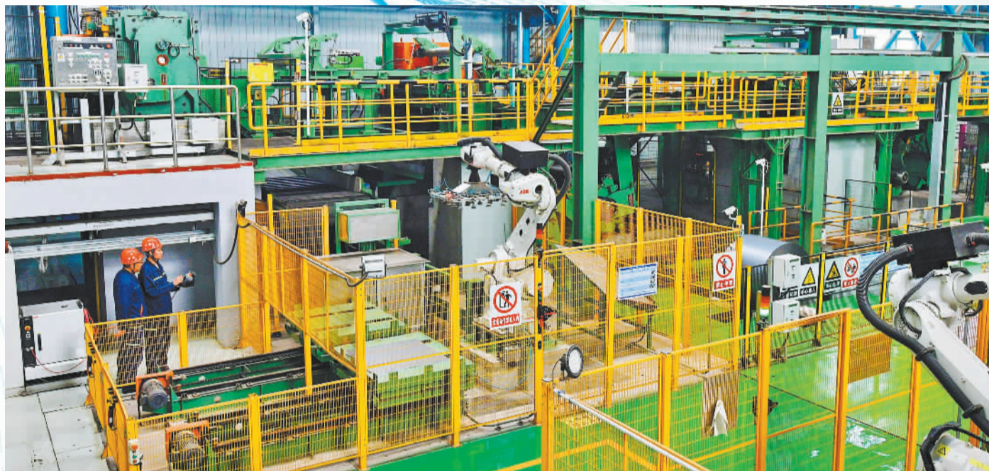
▲4月17日，河北省迁安市鑫达钢铁集团的工作人员在监测工业互联网智能平台数据。