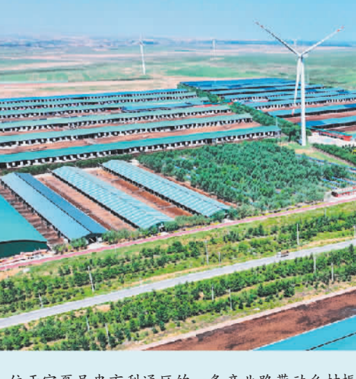
位于宁夏吴忠市利通区的一条产业路带动乡村振兴。

今年，宁夏将实施新一轮农村公路提升行动，推进片区组团式乡村路网建设，支持新建泾源县城至滑雪场等一批旅游路、资源路、