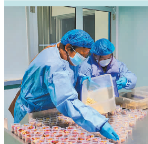
农村公路助力产业发展，银川市永宁县闽宁镇村民实现家门口就业。

一条高质量的农村公路，是赋能乡村振兴的长久支撑。建好“这条路”，非一日之功。2022年，宁夏实现农村公路路况自动化检测全覆盖。“当年年底检测时，我们发现农村公路技术水平整体较低，与‘十四五’规划纲要目标存在差距。”宁夏