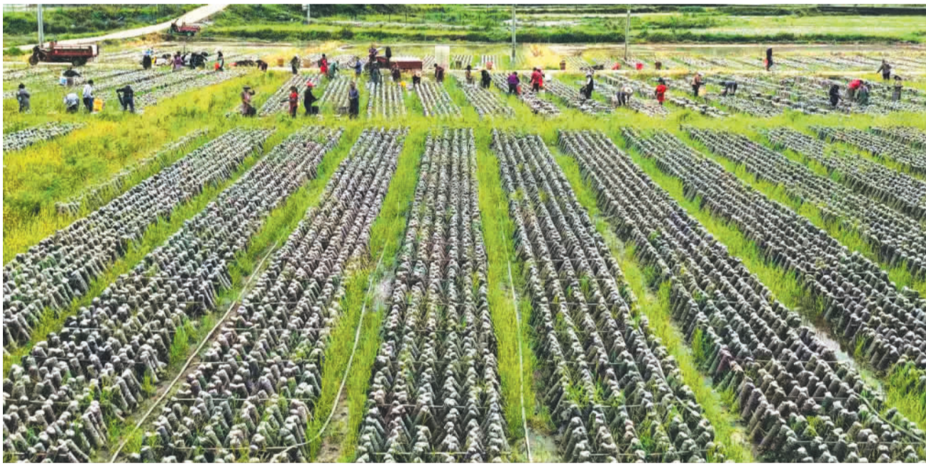
4月23日，在贵州省铜仁市印江土家族苗族自治县合水镇兴旺坝，当地村民忙着采收今年的最后一茬春木耳。近年来，合水镇采取水稻、黑木耳轮作的方式，年发展黑木耳500万余棒，年产木耳60万斤以上，既解决了周边地区450名群众的长期稳定就业问题，又大幅提高了土地产值，为当地乡村振兴提供了有力产业支撑。

政企同心、向海图强。据了解，下一步象山将着力构建“六港联动”空间，加快建设8条海洋经济产业赛道，高水平建设海洋经济发展示范区，力争全年海洋生产总值超过345亿元、完成投资156亿元。