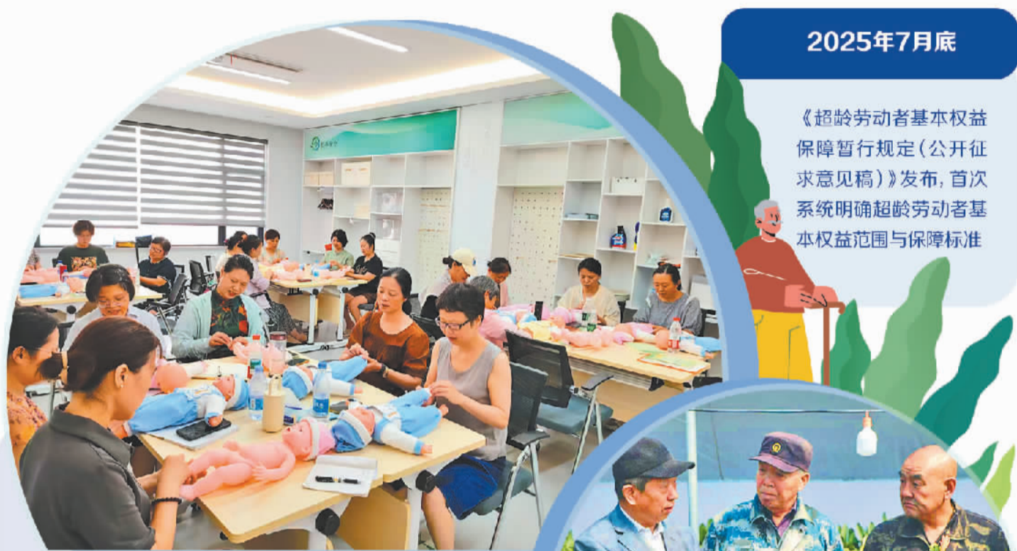
江苏苏州太仓市“银发零工驿站”在进行育婴师职业技能公益培训。

打假，不该是一门生意，而应是一份守护公平的责任。唯有以法规划定边界，以监管纠偏乱象，以平台强化自律，让职业打假回归维权本位，才能真正保护消费者合法权益，营造诚信有序、公平清朗的市场环境，让经营者安心经营、消费者放心消费。