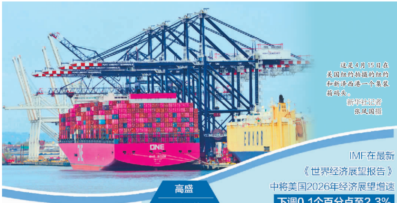
这是4月15日在美国纽约拍摄的纽约和新泽西港一个集装箱码头。