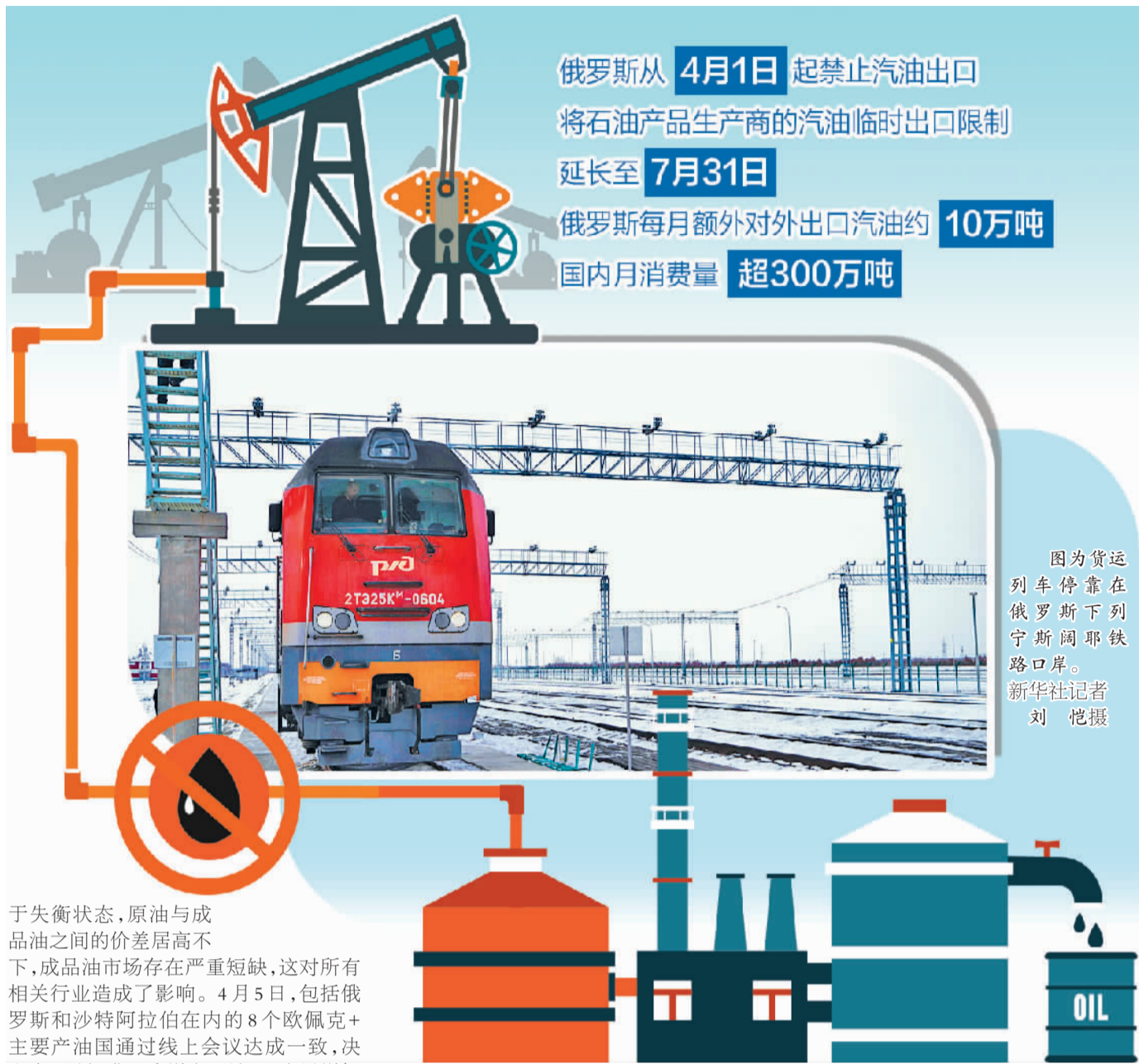
图为货运列车停靠在俄罗斯下列宁诺耶铁路口岸。

于失衡状态，原油与成品油之间的价差居高不下，成品油市场存在严重短缺，这对所有相关行业造成了影响。4月5日，包括俄罗斯和沙特阿拉伯在内的8个欧佩克+主要产油国通过线上会议达成一致，决定自5月起进一步增产石油，日产量增加20.6万桶。其中，俄罗斯的生产配额将每日增加6.2万桶，从963.7万桶增至969.9万桶。