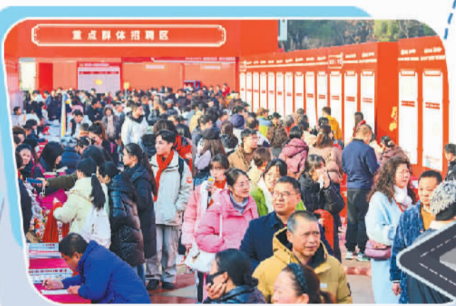
湖北省2026年“抓创业促就业”春风行动启动活动在黄石市人民广场举行,活动吸引了众多求职者前来应聘。