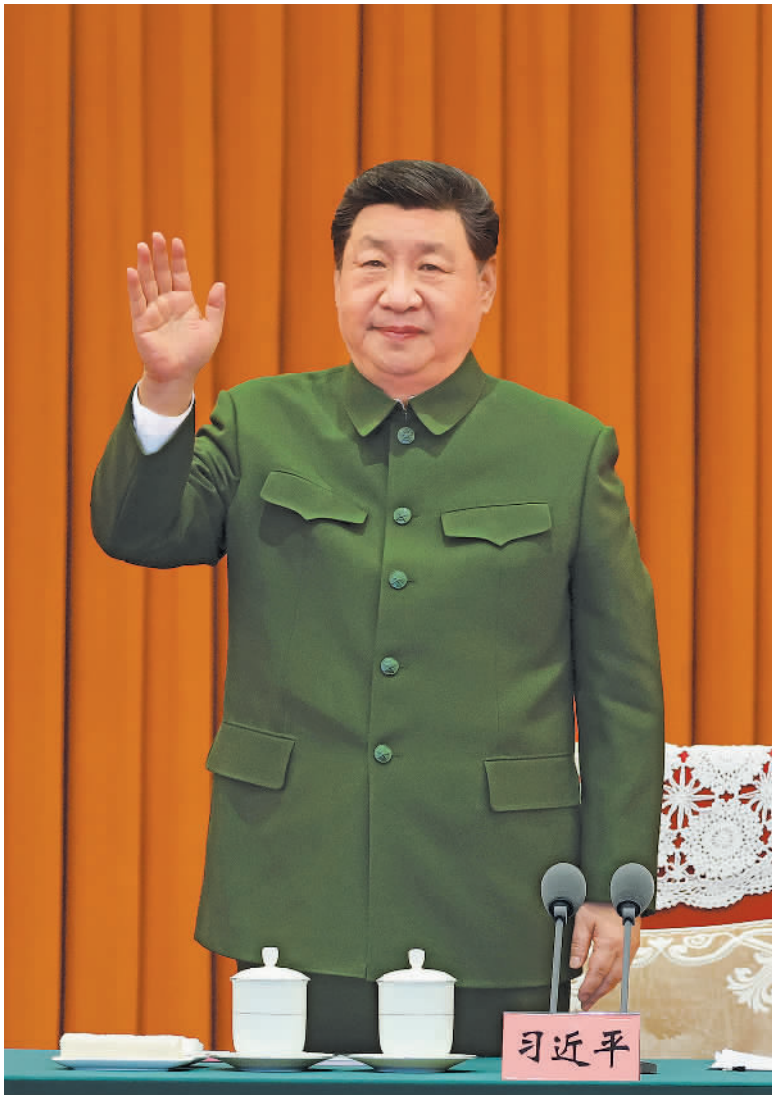
左图 2月10日,中共中央总书记、国家主席、中央军委主席习近平在北京八一大楼以视频方式检查全军战备值班和执行任务情况,亲切慰问有关部队,代表党中央和中央军委,向全体人民解放军指战员、武警部队官兵、军队文职人员、预备役人员和民兵致以诚挚问候和新春祝福。这是习近平向官兵挥手致意。