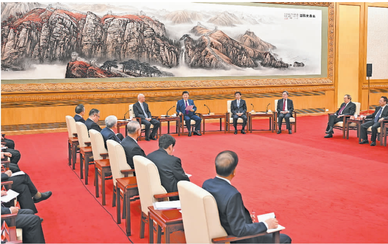
2月11日,习近平、王沪宁、蔡奇、丁薛祥等在北京人民大会堂同党外人士欢聚一堂,共迎佳节。

新华社北京2月11日电 在中华民族传统节日丙午马年春节即将到来之际,中共中央总书记、国家主席、中央军委主席习近平11日下午在人民大会堂同各民主党派中央、全国工商联负责人和无党派人士代表欢聚一堂,共迎新春。习近平代表中共中央,向各民主党派、工商联和无党派人士,向统一战线广大成员,致以诚挚问候和美好祝福。