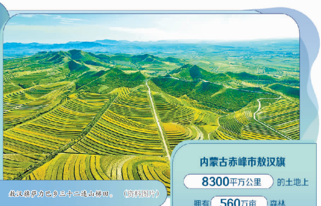
敖汉旗萨力巴乡三十二连山梯田。(资料图片)

在内蒙古赤峰市东南部，努鲁尔虎山北麓与科尔沁沙地南缘的交汇处，敖汉旗8300平方公里的土地上拥有560万亩森林，森林覆盖率达到40.6%。而在新中国成立之初，敖汉旗荒漠化率高达76%，自然植被覆盖率不足10%。敖汉旗上演了一场跨越半个世纪的生态“逆袭”，不久前摘得“国家生态文明建设示范区”称号。通过治一片沙、绿一座山、富一方人，敖汉旗让生态红利实实在在装进老百姓口袋。