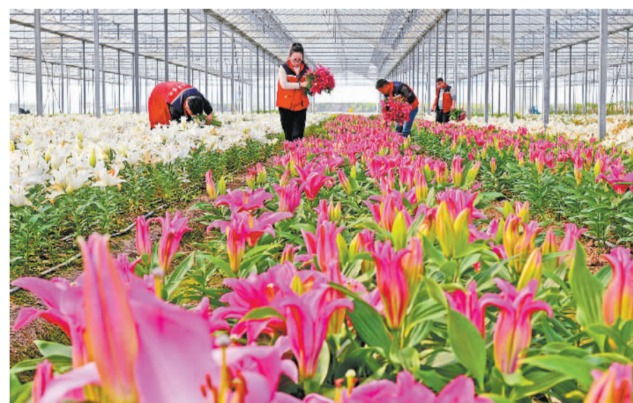
浙江省金华市东山区岭下镇两岸农业科技产业园智慧大棚里，工作人员在忙着采收百合花，供应新春佳节元宵花市场。

积微成著，聚沙成塔。防城港市微改革微创新，精准命中了发展的关键环节与人民群众的核心关切。防城港市委书记黄江说，这些改革的触角延伸至社会机体的末梢，用“小确幸”汇聚成城市发展的“大幸福”，用持续优化的营商“软环境”锻造出高质量发展的“硬实力”，为加快建设现代化临港工业城市注入源源不断的发展动能。