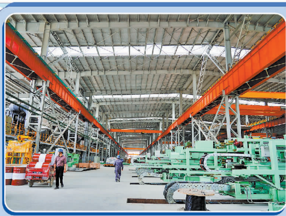
防城港市全程跟踪服务模式推动广西宏旺硅钢及冷轧镀锌板项目如期投产。