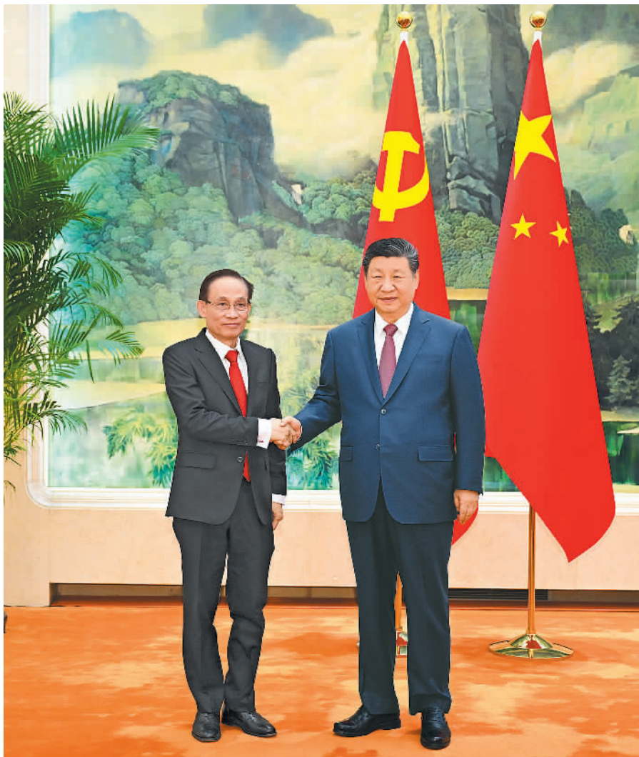
2月4日下午,中共中央总书记、国家主席习近平在北京人民大会堂会见作为越共中央总书记苏林特使专程来访的越共中央政治局委员、外交部长黎怀忠。