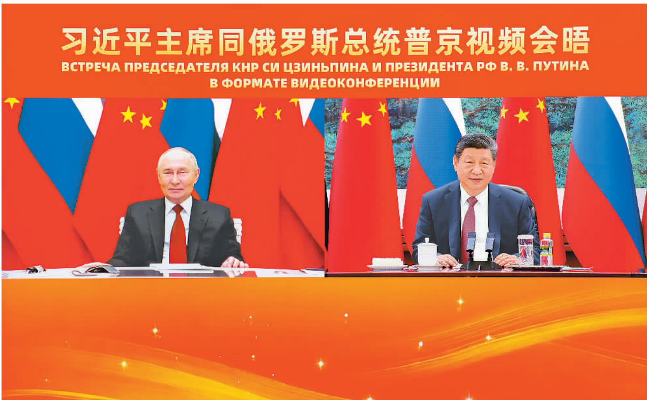
2月4日下午,国家主席习近平在北京人民大会堂同俄罗斯总统普京举行视频会晤。