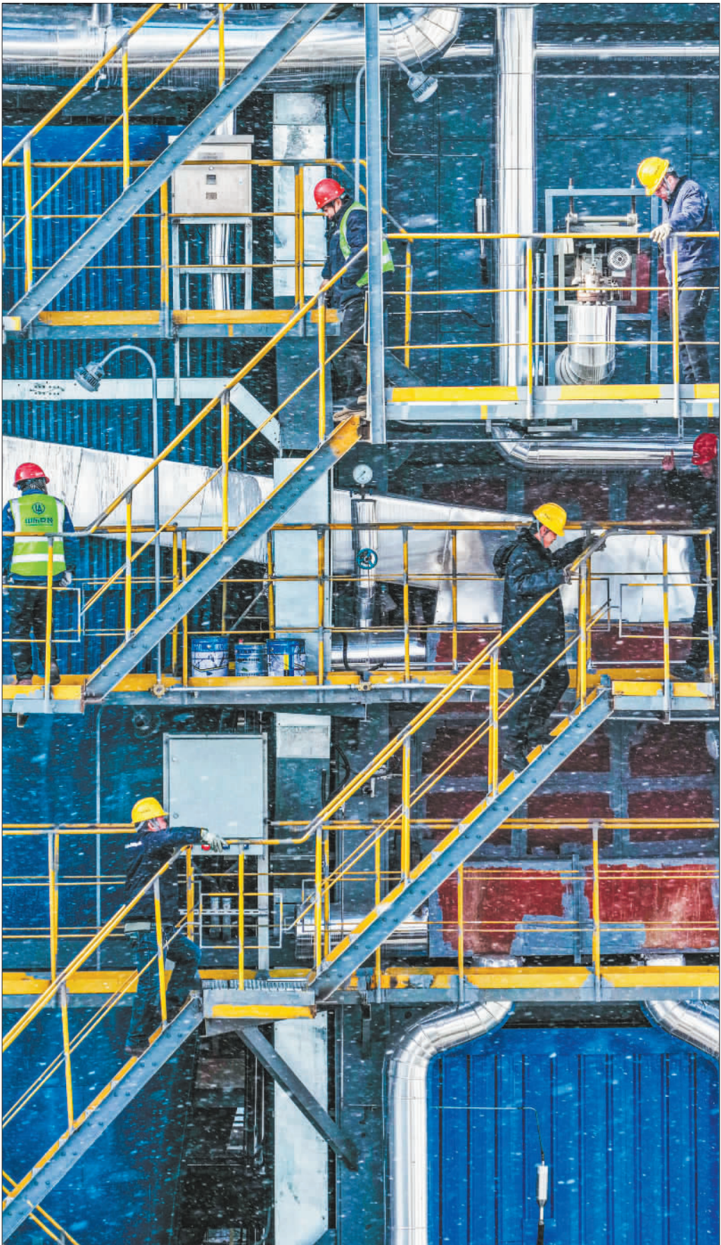
▲1月20日,工作人员在山东省荣成市热电厂巡检锅炉设备,确保供暖设备保持正常运转。