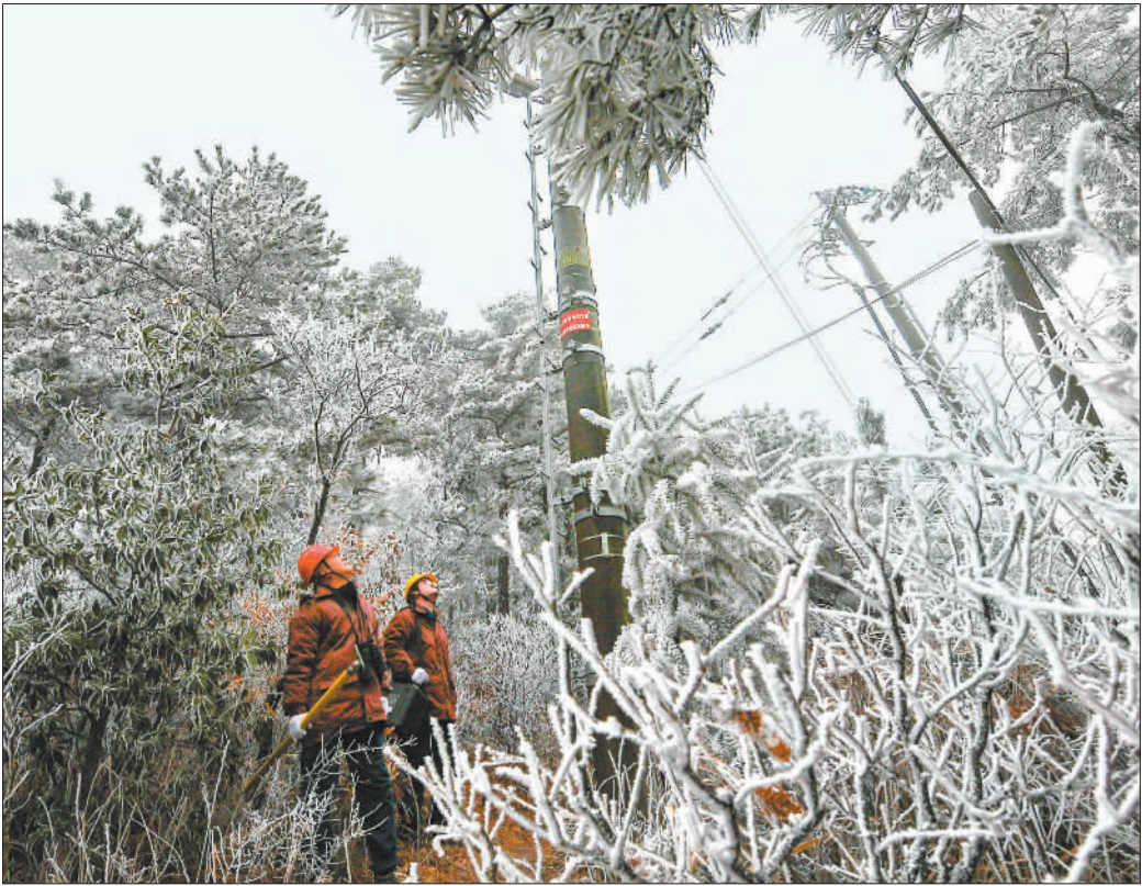
▼1月20日,浙江省金华市,国网金华婺城供电公司罗店供电所工作人员巡查山区电力线路。