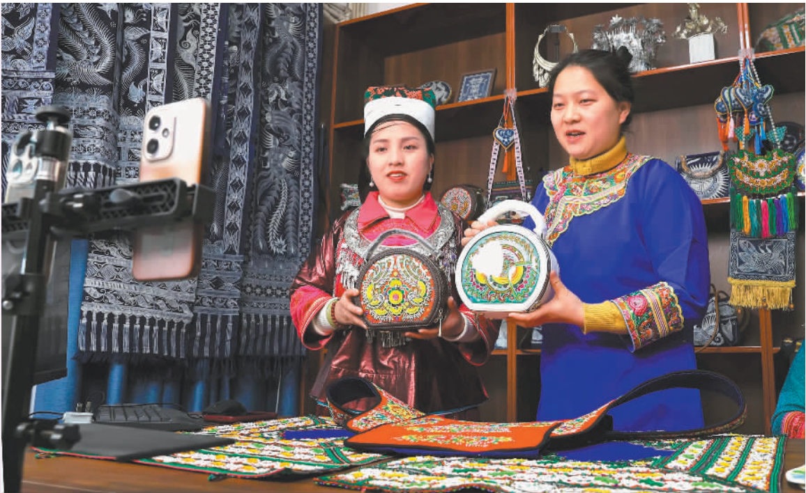
▲2025年10月19日,江西南昌市第七届VR/AR产业博览会上,观众在体验VR设备。 ▲1月7日,贵州榕江县车民街道富民社区,主播在直播销售刺绣手提包。2025年,全国网上零售额159722亿元,比上年增长8.6%。 ▼1月3日,湖北武汉市,市民游客在光谷人形机器人7S店试用机器人产品。近年来,数字产品领域标杆产品密集突破,不断更新数字消费新场景。