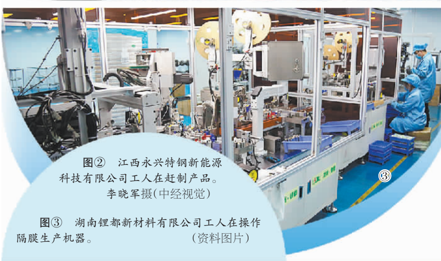
图② 江西永兴特钢新能源科技有限公司工人在赶制产品。 图③ 湖南锂都新材料有限公司工人在操作隔膜生产机器。

为了支持企业发展，宁远县组建中小微企业融资担保有限公司，出台贷款延期还本付息政策，还成立聚能产业投资基金，联动各类资本参与园区建设。“我们把职业中专建在园区里，企业需要什么技能的工人，学校就开设什么专业，用工难题就地解决。”宁远县高新区企业服务中心工作人员介绍，2025年牵头成立的永州市锂电产业联盟，让企业间的合作更紧密，《宁远县促进工业高质量发展的八条政策措施》更成为产业发展的“定心丸”。