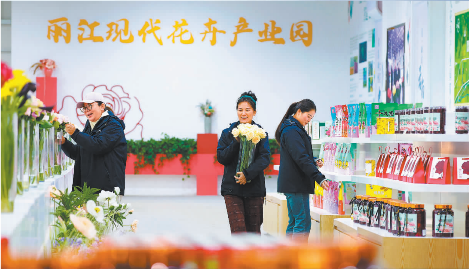
▲2025年12月6日，丽江现代花卉产业园，工作人员在整理鲜切花。当地积极发展观光、研学等农文旅融合项目，努力让花卉这一“美丽产业”成为造福群众的“幸福产业”。