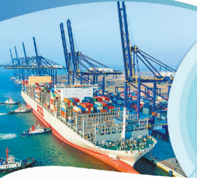
2025年12月17日上午,来自香港的16.5万吨级大型集装箱船“东方邻金鑫”轮顺利靠泊洋浦国际集装箱码头。