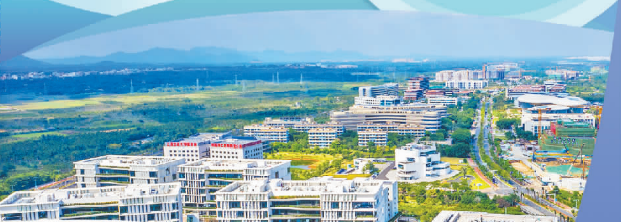
图为海南自贸港重点园区——博鳌乐城国际医疗旅游先行区。

人机科技服务有限公司,已从最初的单打独斗发展为拥有9名员工的成熟团队,业务涵盖无人机执照培训、无人机表演、农林植保等多个领域。“中心提供的工商财税代办、办公场地优惠、创业导师指导等一站式服务,让我们少走了很多弯路。”郭志福说,“2025年公司营收突破500万元,同比增长200%,这离不开海南对港澳青年创业的扶持。未来我们计划拓展东南亚市场,借助海南自贸港的政策优势,把无人机业务做得更大更强。”